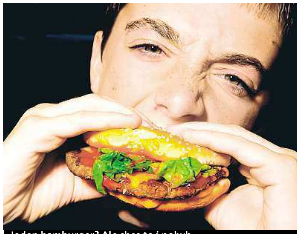
Jeden hamburger? Ale chce to i pohyb.

V Evropské unii jsou dnes tři miliony obézních dětí. Školy si svůj podíl na problému uvědomují a snaží se změnit stravovací návyky žáků. „Luštěniny, kuskus či pohanka jsou běžně zařazovány do jídelníčku většinou jako hlavní jídlo v kombinaci se zeleninou, tofu nebo rybou a také