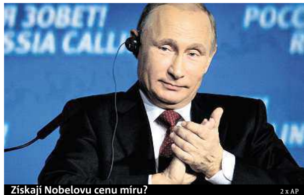
Získají Nobelovu cenu míru?

Výbor udílející Nobelovy ceny míru sklízí v posledních letech kritiku za volbu diskutabilních kandidátů. Kupříkladu v roce 2009 získal ocenění krátce po svém nástupu do úřadu americký prezident Barack Obama, v roce 2012 překvapivě Evropská unie. I mezi letošními kandidáty je řada kontroverzních jmen, mimo jiné bývalý spolupracovník amerických tajných služeb Edward Snowden či ruský prezident Vladimir Putin kritizovaný Západem za vměšování do konfliktu na Ukrajině.