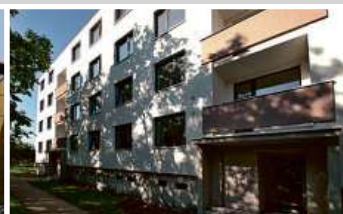
Bytový dům, Brno-Čhrlice