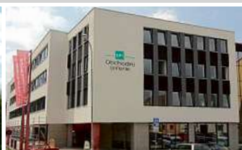
Obchodní galerie, Jihlava