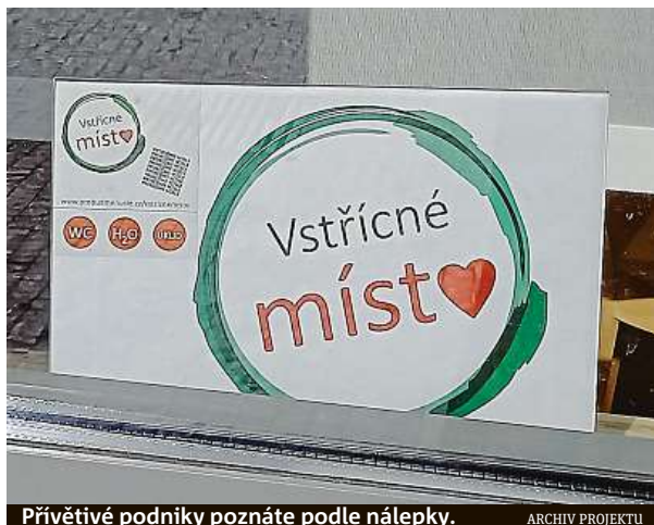
Přívětivé podniky poznáte podle nálepky.

Další možnost je piktogram WC. „Ten znamená, že kolemjdoucí mohou i bez nutnosti nákupu využít toale-