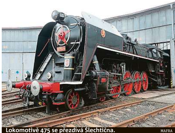
Lokomotivě 475 se přezdívala Slechtična.

Fanoušci dopravy nebudou o víkendu vědět kam dřív. Nabídka je bohatá. Sobotní svátek železnice na Masarykově nádraží nabídne jízdy historickými i moderními typy vlaků po Praze či okolí. Soupravy se vydají například do Kralup nad Vltavou, Hostovic nebo do Českého Brodu. Lidem se na kolejích představí