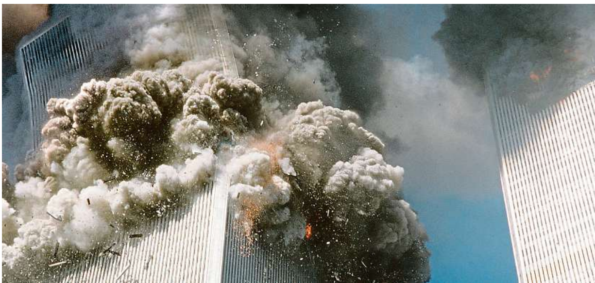
Světové obchodní centrum během útoku. Roku 2014 byl na místě otevřen nový mrakodrap One World Trade Center.

tému září jsme bývali mohli zabránit. Byla to otázka propojení informací, které jsme měli k dispozici.“ Agentury CIA a FBI prosadily obecnou poučku „sesbírejte veškerá data, která můžete“.