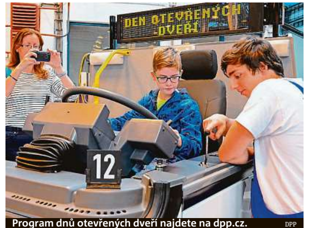
Program dnů otevřených dveří najdete na dpp.cz.

Program si na víkend připravil také dopravní podnik. Konají se hned dva dny otevřených dveří. V sobotu zve do svého areálu Vozovna Vokovice. Připraveny jsou například dynamická ukázkou zvedání čela tramvaje typu T3 nebo prezentace nového vprošťovacího jeřábu Volvo. V areálu vozovny se pak fanoušci tramvají mohou detailně seznámit s vozy T3 PLF, 14T, 15T, T3RP se sněhovým pluhem, KT8N2, T6A5, s historickým vozem 240 + 682 a legendární mazačkou. Při-