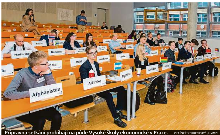
Přípravná setkání probíhají na půdě Vysoké školy ekonomické v Praze. PRAŽSKÝ STUDENTSKÝ SUMMIT

Jedná se o celoroční projekt – studenti postupně na pěti přípravných setkáních získávají prostřednictvím vzdělávacích aktivit a seminářů zkušenosti, které pak využijí v ostrých jednáních na závěrečné konferenci. Měla by se konat od 24. do