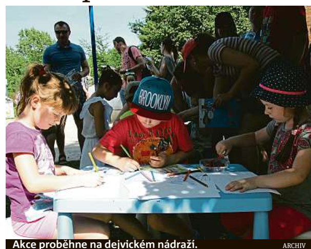
Akce proběhne na dejvickém nádraží.

Chybět nebudou ani stánky s informacemi o přípravě výstavby vysokorychlostních tratí v Česku nebo o plánovaných i probíhajících stavbách na železnici. Prostor dostanou také pravidla bezpečné železnice s tematickou soutěží o ceny a prezentace Správy železnic coby perspektivního zaměstnavatele. Ukázky svojí