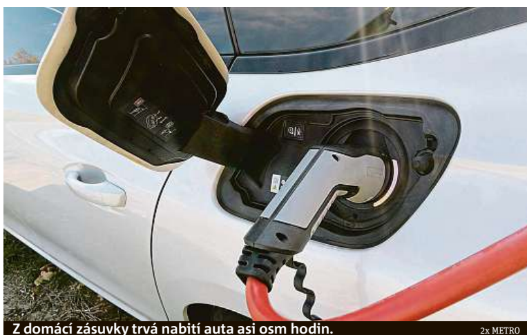
Z domácí zásuvky trvá nabíjení auta asi osm hodin.