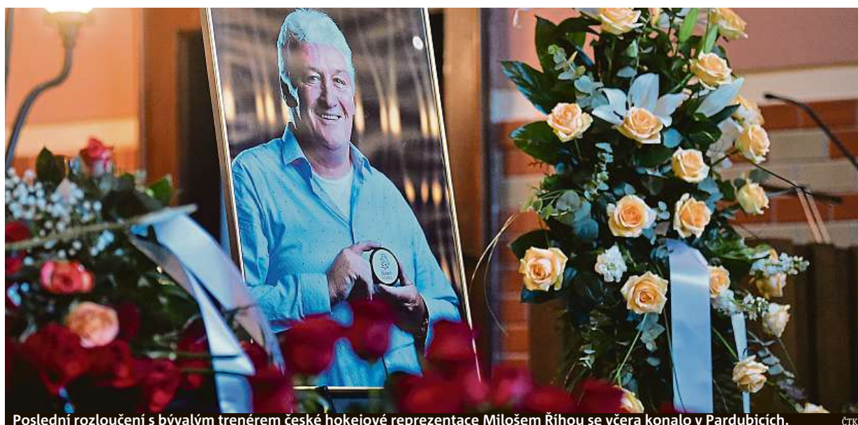
Poslední rozloučení s bývalým trenérem české hokejové reprezentace Milošem Říhou se včera konalo v Pardubicích.

Pandemie koronaviru. Je na vzestupu, ode dneška v celé zemi musíme mít zakrytá ústa a nos ve vnitřních prostorách. I zaměstnanci. Pracují-li vedle sebe do dvou metrů. Trasování. Nakažený se nahlásí sám STRANA 2