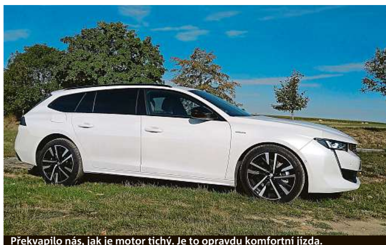
Překvapilo nás, jak je motor tichý. Je to opravdu komfortní jízda.

čtyřválec 1,6 litru (133 kW) doplněný o elektromotor (80 kW), který je integrován do automatické osmistupňové převodovky, hnaná jsou pouze přední kola. Kapacita baterie je 11,8 kWh, dojezd čistě na elektrický pohon 52 km. Kombinovaná spotřeba při běžné jízdě se pohybuje kolem tří litrů. Pokud máte auto kde nabíjet, je to skvělá volba. Když přimhouříte oči nad vyšší cenou. HOPE