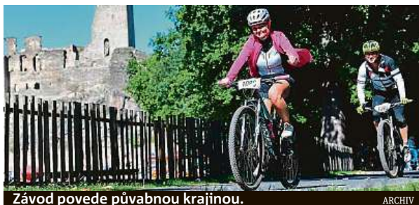
Závod povede půvabnou krajinou.

Již 19. září se pojede 22. ročník tradičního cyklozávodu se startem v dejvické Bechyňově ulici, otočkou na Okoři a cílem před Fakultou architektury ČVUT. Trasa je dlouhá přesně 50 kilometrů, převýšení má 910 metrů. Pojede se přes Dejvice, Horoměřice, Velké Přílepy, Podholí, Hole, Zákolany, Budeč, Nový mlýn, Okoř, Malé Čičovice, Tucho-