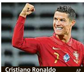
Cristiano Ronaldo

Portugalec musí dát ještě osm gólů za reprezentaci.