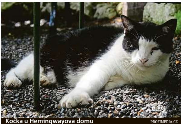
Kočka u Hemingwayova domu

Po spisovatelově smrti v roce 1961 se dům stal jednou z největších atrakcí na ostrově ležícím asi 100 kilometrů jižně od Miami, kde kvete nicnedělání a kde se lidé věnují popíjení koktejlů, potápění a opalování. Uzavření hranic brání zahraničním turistům navštívit ostrov a od března tu nepřistála ani jediná výletní loď. Minulý týden museli propustit 30 z 45 zaměstnanců domu a muzea Hemingwaye. „Měl jsem šest průvodců. Teď už mám jen čtyři,“ lamentuje jeho ředitel Andrew Morawski. Ti, co zde zůstali, nabízejí jako vždy komentované prohlídky a starají se o padesátku koček se šesti prsty. Všechny jsou potomky té s genetickou anomálií,