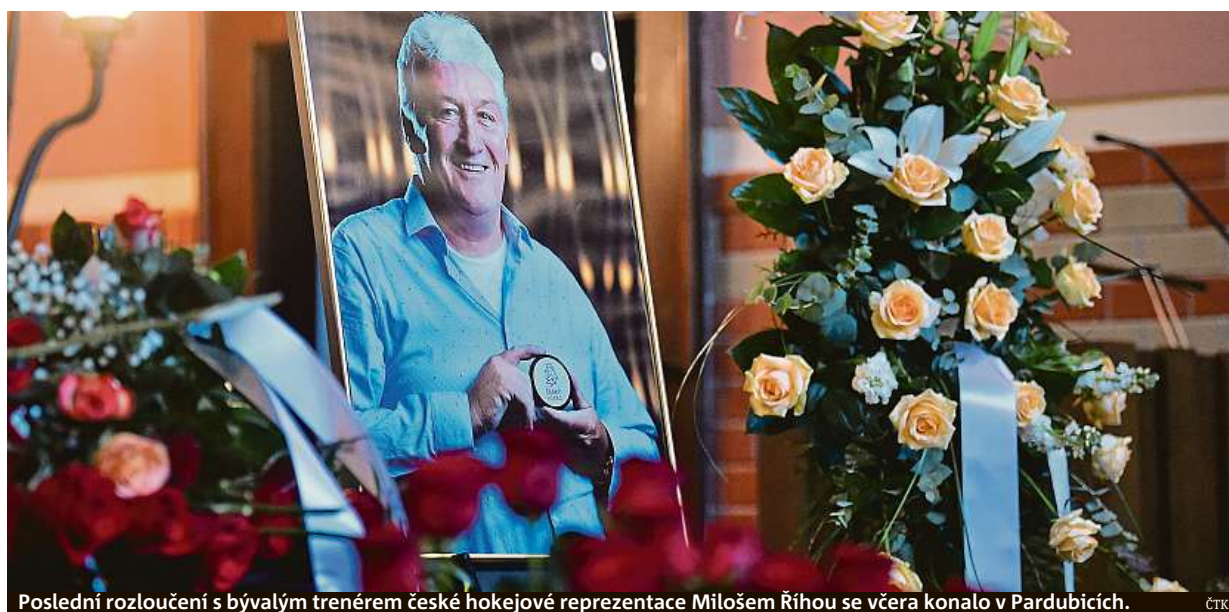
Poslední rozloučení s bývalým trenérem české hokejové reprezentace Milošem Říhou se včera konalo v Pardubicích.

Pandemie koronaviru. Je na vzestupu, ode dneška v celé zemi musíme mít zakrytá ústa a nos ve vnitřních prostorách. I zaměstnanci. Pracují-li vedle sebe do dvou metrů. Trasování. Nakažený se nahlásí sám STRANA 2