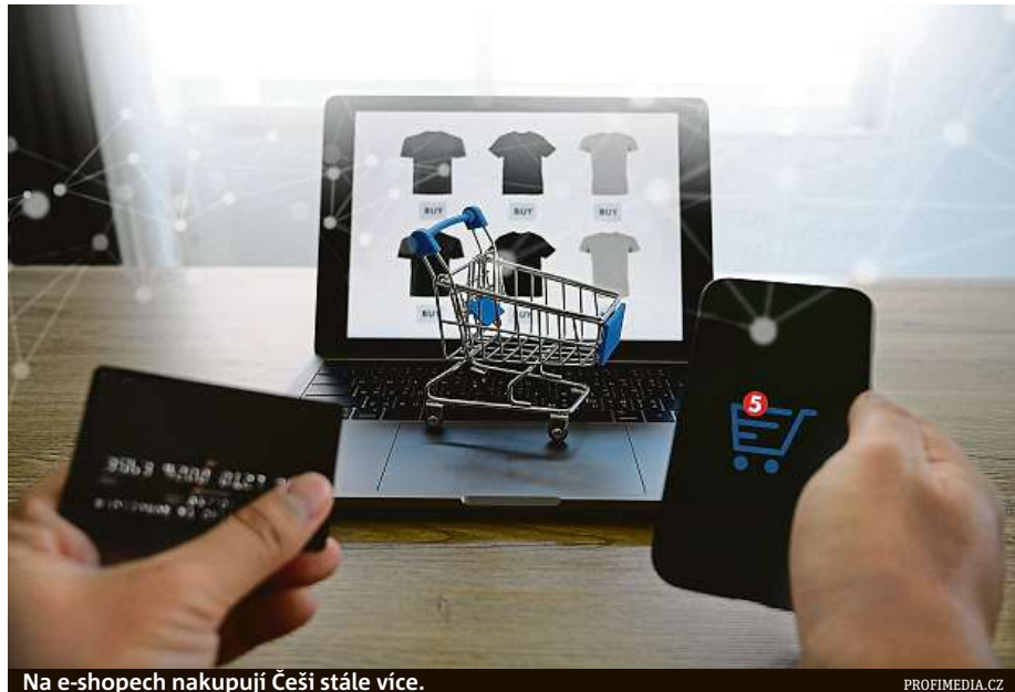
Na e-shopech nakupují Češi stále více.

Podle manažera doručovací služby DoDo Tomáše Tenkrát by měly distribuční strategie a řízení logistiky vycházet ze zákaznického servisu: „E-shopy by se na ně měly dívat z pohledu lidí, kteří u nich nakupují. Strategii by měly řešit celoročně.“