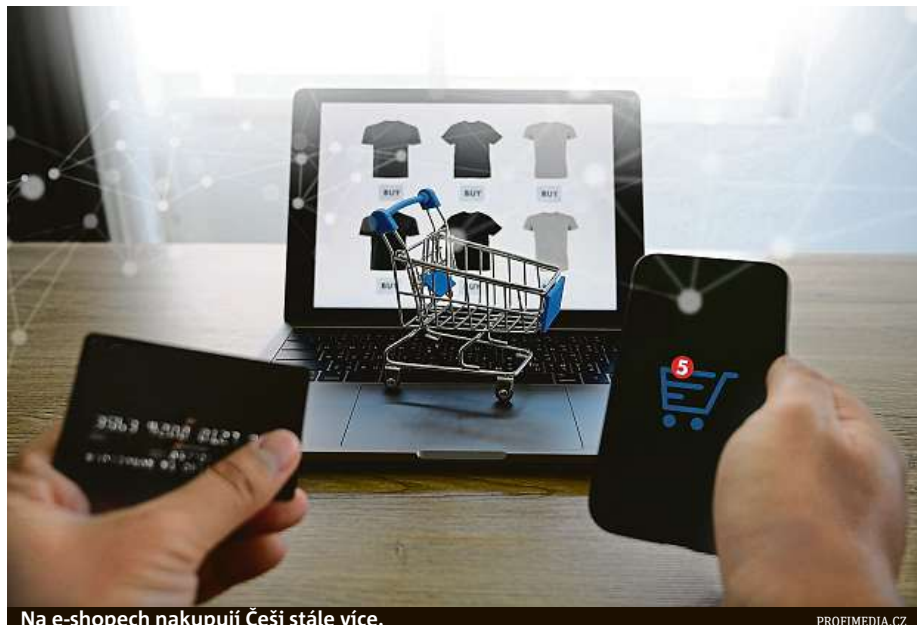
Na e-shopech nakupují Češi stále více.

Podle manažera doručovací služby DoDo Tomáše Tenkrát by měly distribuční strategie a řízení logistiky vycházet ze zákaznického servisu: „E-shopy by se na ně měly dívat z pohledu lidí, kteří u nich nakupují. Strategii by měly řešit celoročně.“