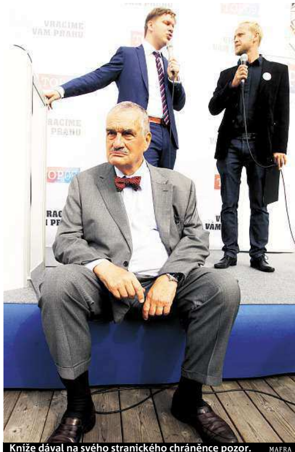
Kniže dával na svého stranického chráněnce pozor.