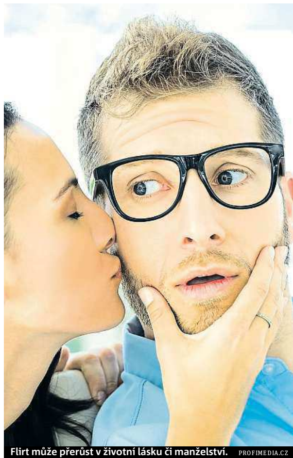
Flirt může přerůst v životní lásku či manželství.