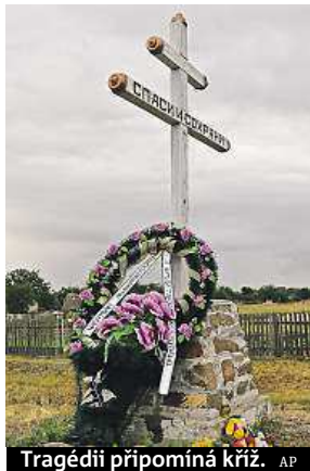
Tragédii připomíná kříž.

Příčinou červencového pádu malajsijského boeingu na východní Ukrajině nejspíš bylo zasažení letadla „množstvím vnějších objektů s vysokou energií“. Uvádí se to v před-