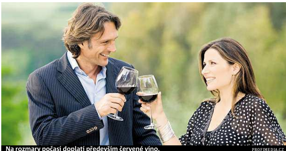
Na rozmary počasí doplatí především červené víno.

Mezi pražskými vinohrady jsou však i takové, kterým letošní atypická sezona neuškodila. „Úroda je srovnatelná s jinými roky,“ potvrzuje Drahoмира Kolmanová, vedoucí úseku zeleně na Vyšehradě, kde byly vinice založeny na stře-