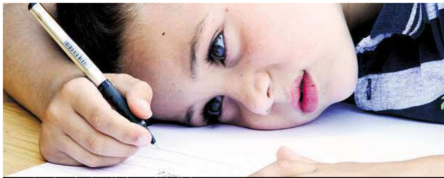
Dostávat hned zrána úkoly není ideální.

Stejnou myšlenku mu připomněl teď nedávno i prezident Miloš Zeman, když v lánkové škole vítal prvňáčky. „Jsem zvědav, jestli se mu to povede,“ pravil pobaveně Zeman. Podle všeho nepovede,