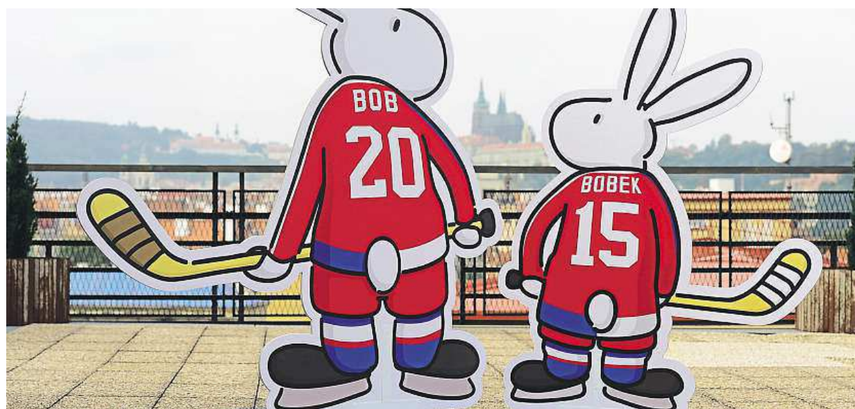
Hokejové mistrovství světa 2015 v Česku budou poprvé v historii doprovázet dva maskoti – populární králíci Bob a Bobek. ČTK

Začátek vyučování. Začínat až v devět hodin je myšlenkou ministra školství Chládky. Volba. První zvonění je dané vyhláškou mezi sedmou a devátou hodinou. Psycholog. Děti by měly chodit do školy za světla STRANA 5