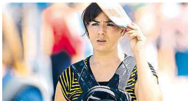
I do Česka proudí stále více turistů.