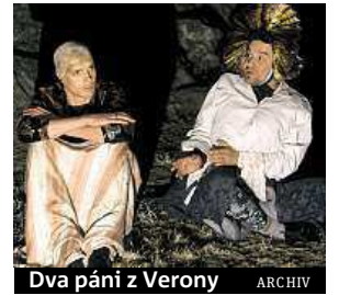
Dva páni z Verony