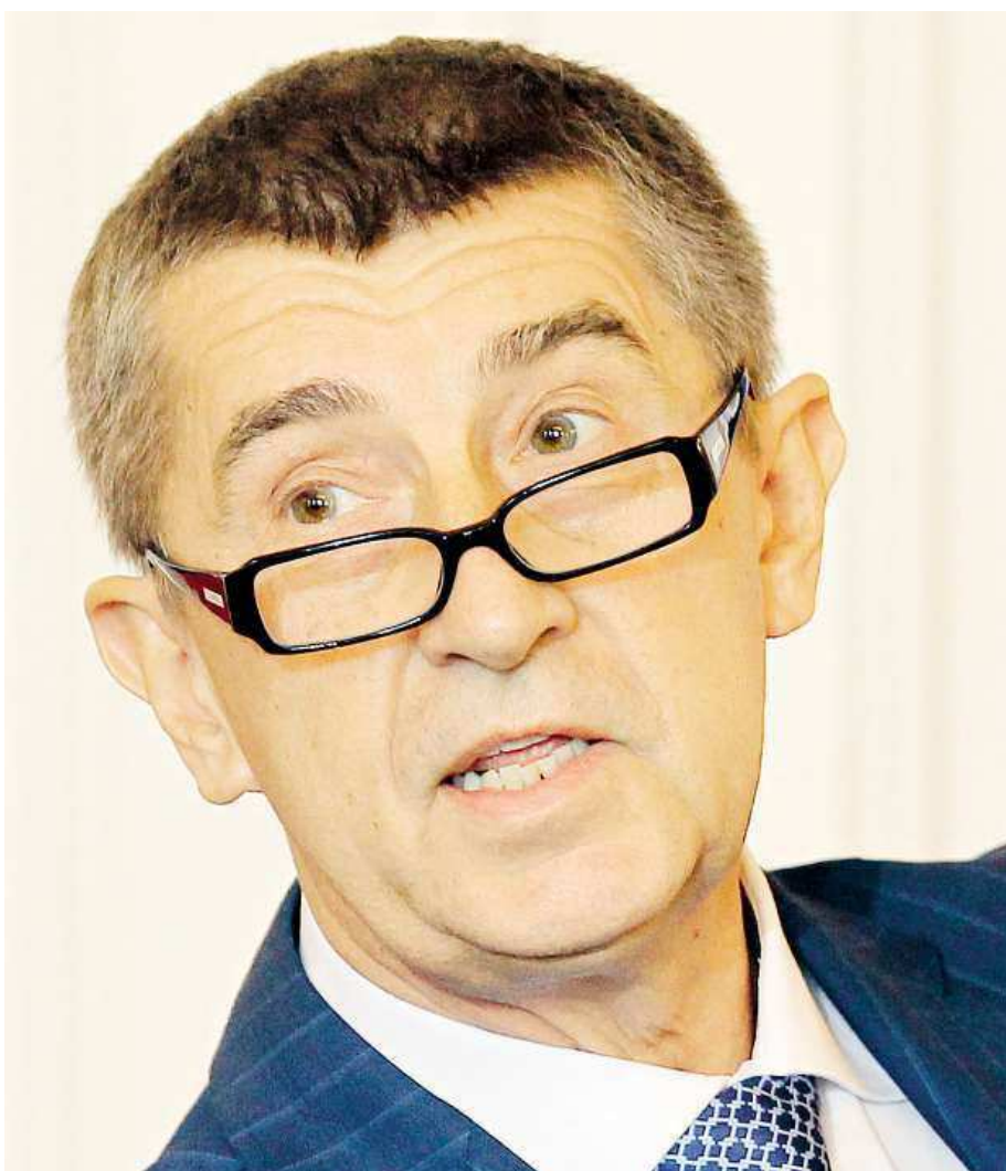
„My že nemáme dostatek lidí? Jsme hnutí otevřené pro každého,“ tvrdí Babiš.

To ne. My bychom v Praze uspět chtěli. Praha je totiž obrazem velice negativního působení politických stran. Tady jsou ti největší kmoťi, tady se dělají ta největší zvě-