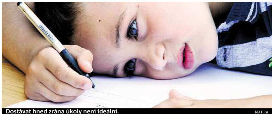
Dostávat hned zrána úkoly není ideální.

Stejnou myšlenku mu připomněl teď nedávno i prezident Miloš Zeman, když v lánkové škole vítal prvňáčky. „Jsem zvědav, jestli se mu to povede,“ pravil pobaveně Zeman. Podle všeho nepovede,