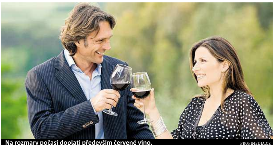
Na rozmary počasí doplatí především červené víno.

Mezi pražskými vinohrady jsou však i takové, kterým letošní atypická sezona neuškodila. „Úroda je srovnatelná s jinými roky,“ potvrzuje Drahoмира Kolmanová, vedoucí úseku zeleně na Vyšehradě, kde byly vinice založeny na stře-