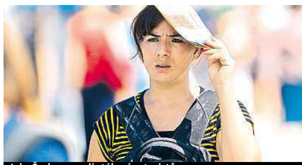
I do Česka proudí stále více turistů.