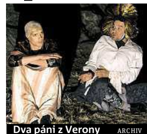
Dva páni z Verony