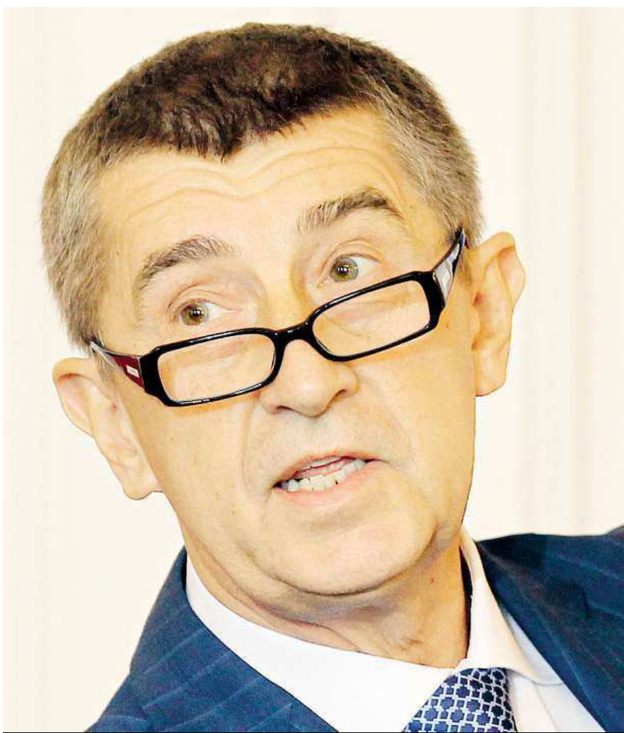
„My že nemáme dostatek lidí? Jsme hnutí otevřené pro každého,“ tvrdí Babiš.

To ne. My bychom v Praze uspět chtěli. Praha je totiž obrazem velice negativního působení politických stran. Tady jsou ti největší kmotři, tady se dělají ta největší zvě-