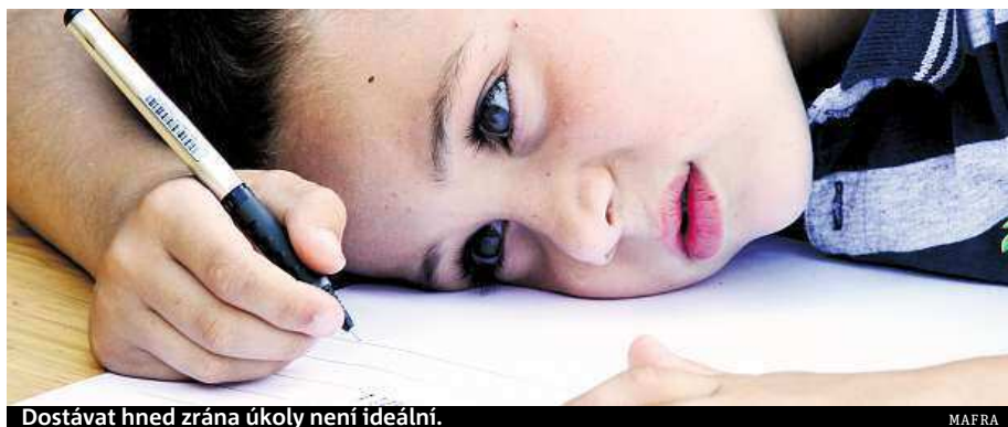
Dostávat hned zrána úkoly není ideální.

Stejnou myšlenku mu připomněl teď nedávno i prezident Miloš Zeman, když v lánkové škole vítal prvňáčky. „Jsem zvědav, jestli se mu to povede,“ pravil pobaveně Zeman. Podle všeho nepovede,