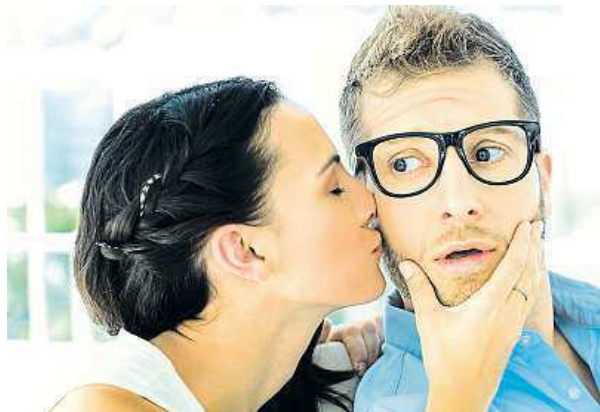
Flirt může přerůst v životní lásku či manželství.

lo vztah se svým spolupracovníkem 52 procent účastníků