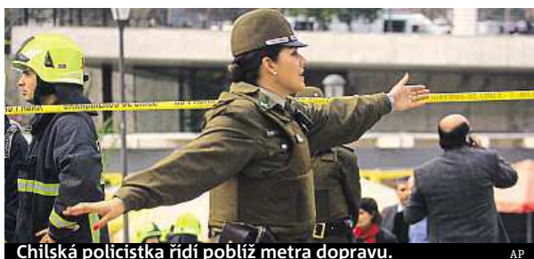
Chilská policistka řídí poblíž metra dopravu.

kovém koši ve stanici nad vojenskou školou. Bacheletová čin označila za hanebný a zdůraznila, že Chile je stále bez-