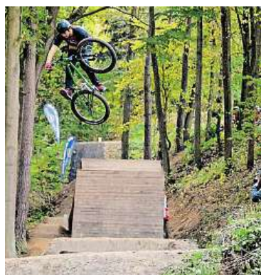
Mini bike park Horky NADACE O2

Mladá generace tráví podle Jihočechů nejvíce času na počítači a sociálních sítích a nemá zájem pomáhat svému okolí. Ukázal to průzkum agentury Ipsos pro Nadaci O 2 , který si dala zpracovat při příležitosti 15. výročí své existence. Skutečnost je ale docela jiná – 16 procent mladých lidí do 29 let z Jihočeského kraje se pomoci svému okolí aktivně věnuje. Další 79 procent dotázaných by rádo pomáhalo, ale neví jak. Důkazem, že mladým Jihočechům není jejich okolí lhostejné, jsou projekty, které v kraji Nadace O 2 podpořila – například Mini bike park v Horkách u Tábora nebo charitativní běh Alfa Run. Přispět své komunitě dobročinným projektem pomáhá mladým lidem Nadace O 2 prostřednictvím programu SmartUp, který je určený pro lidi od 15 do 29 let. „Rok od roku se nám hlásí stále více zajímavých projektů a je velmi obtížné vybrat ty, které následně podpoříme. Program přitom nabízí podporu nejen finanční, ale především vzdělávací – pro mladé realizátory jsou připraveny neformální školení a workshopy a propojujeme je také s lidmi, kteří jim mohou s jejich snažením pomoci,“ vysvětluje Anna Kačabová, ředitelka Nadace O 2 .