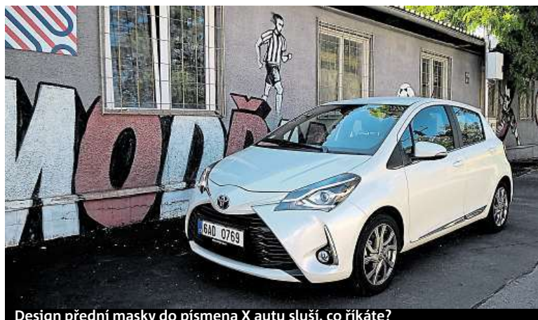
Design přední masky do písmena X auto sluší, co říkáte?

Aktuality a fotografie z ekologické mise můžete také sledovat na jejich Facebooku „Efficient Expeditions / Úsporné Expedice“. HOPE