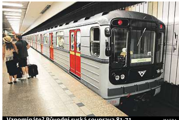
Vzpomínáte? Původní ruská souprava 81-71.

Dopravní podnik oslaví výročí stylově. V sobotu při této příležitosti opět vypraví do provozu původní historickou sovětskou soupravu 81-71, kvůli černé masce někdy přezdívanou Černá huba. „První jízda soupravy proběhne