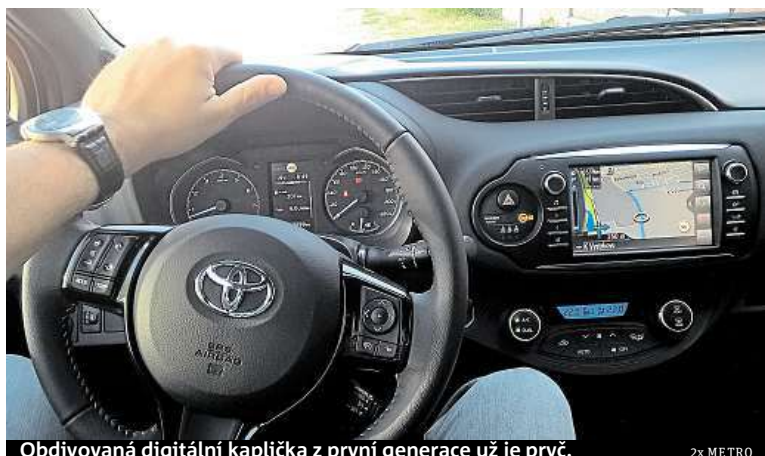
Obdivovaná digitální kaplička z první generace už je pryč.