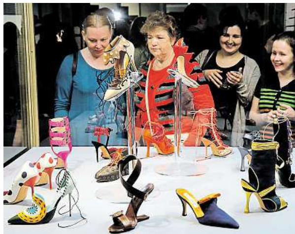
Po Miláně či Petrohradu uvidí výstavu i Pražané.