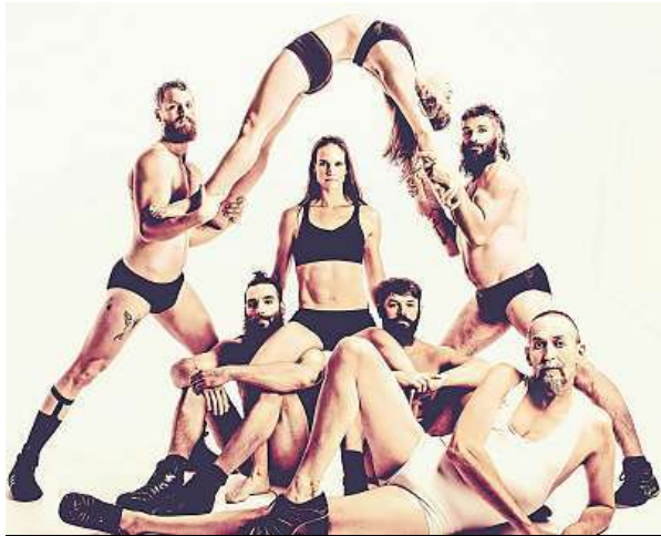
Kanadští Cirque Alfonse nabídnou kabaret Barbu. IDIL SUKAN

Už 14. ročník Letní Letné otevře přesně za týden pro tento festival speciálně připravený open-air program Bestiario – společná prezentace domácích i mezinárodních artistů pod taktovkou renomované režisérky Firenzy Guidi ze světznámého velšského souboru Nofit State Circus. Pod letní oblohou tak vyvrcholí týdenní workshop propojující zahraniční i české artistry a umělce.