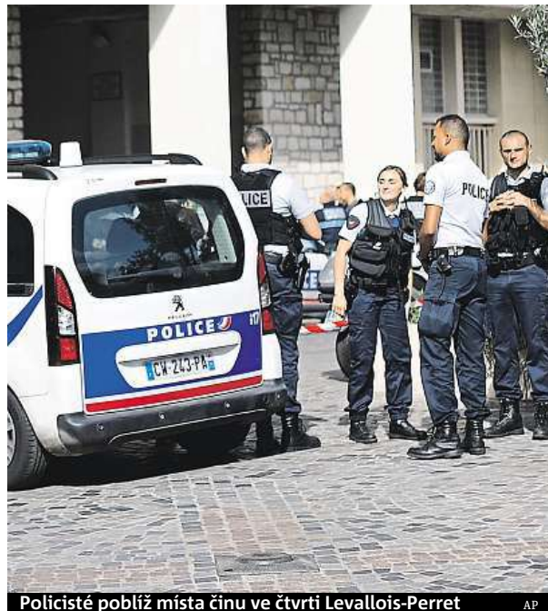
Policisté poblíž místa činu ve čtvrti Levallois-Perret

Operace je předmětem politických diskusí a prezident Emmanuel Macron oznámil, že ji přezkoumá s ohledem na zvýšení efektivity.