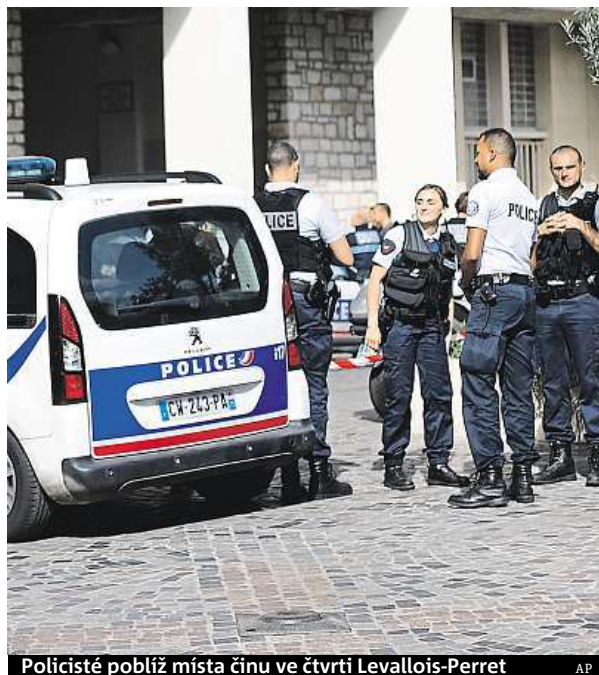
Policisté poblíž místa činu ve čtvrti Levallois-Perret

Operace Sentinel je reakcí na teroristické útoky v redakci časopisu Charlie Hebdo v lednu 2015. Od té doby si útoky v zemi vyžádaly 239 obětí, v poslední době míří hlavně na příslušníky bezpečnostních složek. V rámci této operace je v zemi v pohotovosti 7000 členů ozbrojených složek, polovina z nich je rozmístěna v Paříži. Terčem útoků se stali již v únoru 2015 v Nice, v dubnu 2015 a letos v březnu na pařížském letišti Orly. Operace je předmětem politických diskusí a prezident Emmanuel Macron oznámil, že ji přezkoumá s ohledem na zvýšení efektivity. ČTK, MET