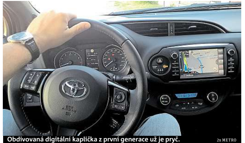
Obdivovaná digitální kaplička z první generace už je pryč.