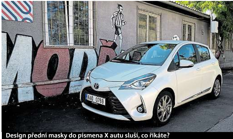
Design přední masky do písmena X auto sluší, co říkáte?

Aktuality a fotografie z ekologické mise můžete také sledovat na jejich Facebooku „Efficient Expeditions / Úsporné Expedice“. HP