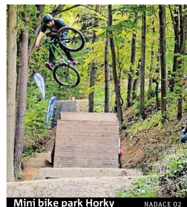
Mini bike park Horky

Vybrané projekty Nadace O 2 v několika vlnách podpoří částkou až do výše 190 tisíc korun. Nic z toho ale nemůže být použito jako finanční odměna pro autora. Jestliže je projekt výdělečný, musí realizátoři získané finance znovu vložit do projektu, anebo je předat vy-