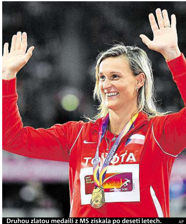
Druhou zlatou medaili z MS získala po deseti letech.

Jaká bude její atletická budoucnost, ještě sama neví. V roce 2020 jsou olympijské hry v Tokiu. „To je možná jediná motivace, která by v mé kariéře mohla být. Je to také moje oblíbené místo. Bylo by to velmi pěkné tam závodit, ale je to ještě dlouho. Nejsem opravdu nejmladší,“ vysvětlovala. V Tokiu by jí bylo 39 let, mohla by tam získat svou čtvrtou olympijskou medaili.