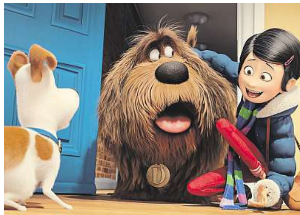
Pes z útulku Baron rozvíří zápletku nového animáku.

Režisér Chris Renaud tvrdí, že na tuto dokonalou rodinu