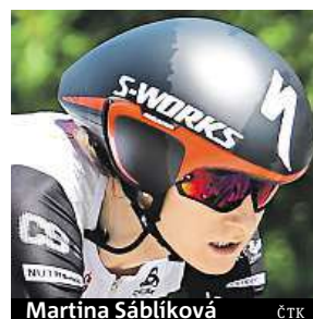
Martina Sáblíková

„V tuto chvíli ve mně samozřejmě převažuje obrovské zklamání, doufala jsem ve start do posledních chvil,“ uvedla Sáblíková. Žila v domnění, že si na loňském MS