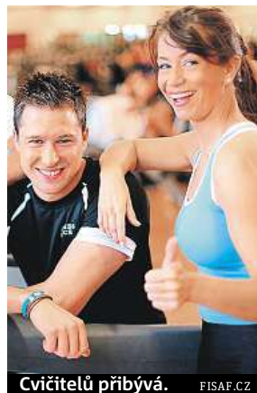
Cvičitelů přibývá. FISAF.CZ

V něm je jasně nastaveno, jaké znalosti a dovednosti je třeba umět pro výkon povolání