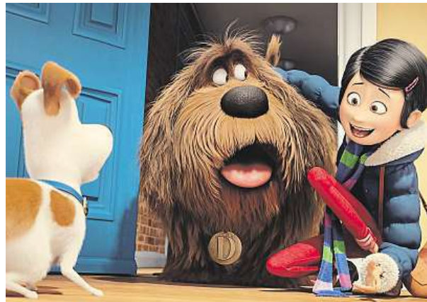
Pes z útulku Baron rozvíří zápletku nového animáku.