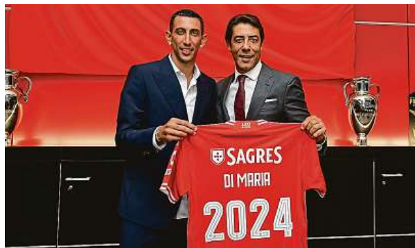
Ángel Di María se do Benfiky vrací po 13 letech.

Talantovaný levý bek přišel do Slavia loni v únoru z Mladé Boleslavi. Ve vršovickém celku se zařadil mezi