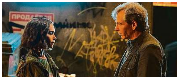
Emilia Clarke a Ben Mendelsohn hrají dceru a otce.