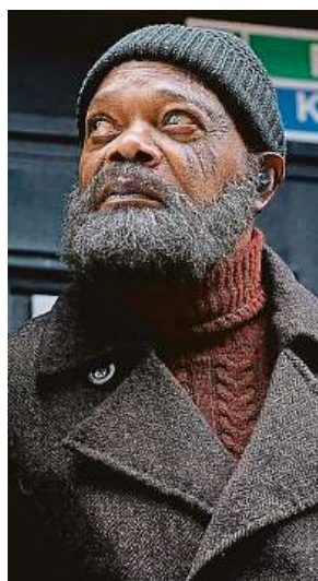
Samuel L. Jackson jako Nick Fury