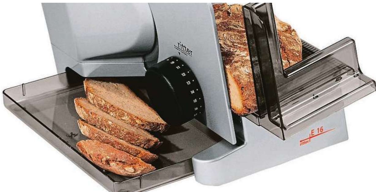
Rezač chleba Ritter E-16

Jednou z nejlepších alternativ v této oblasti je elektrický kráječ Ritter E-16. Díky tomu stroji budou vaše krajíce chleba vždy uříznuté naprosto perfektně a na správnou tloušťku. Tloušťku řezu lze plynule nastavit až do 20 mm a díky příkonu 65 W nedělá kráječ problém ani tvrdší pecen chleba. Kráječ dále disponuje bezpečnostním vypínačem a dalšími ochrannými prvky, které činí jeho použití