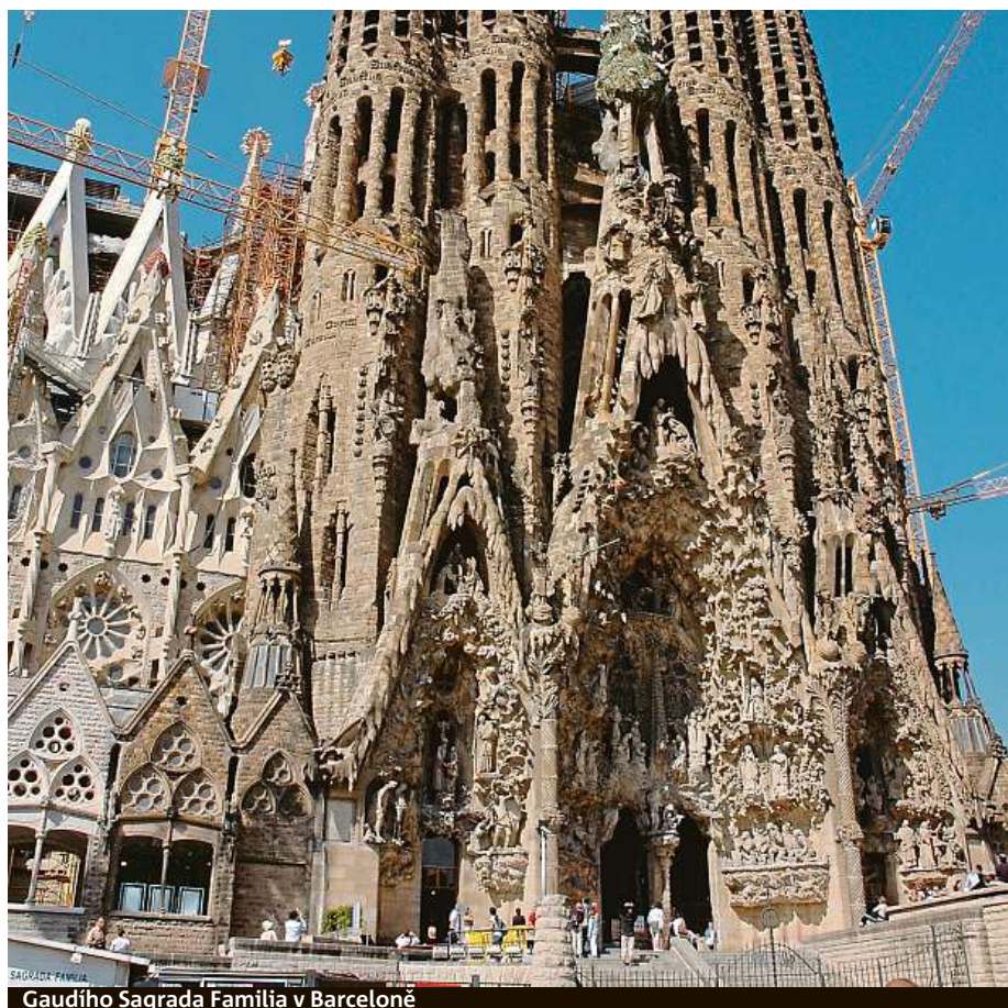
Gaudího Sagrada Família v Barceloně