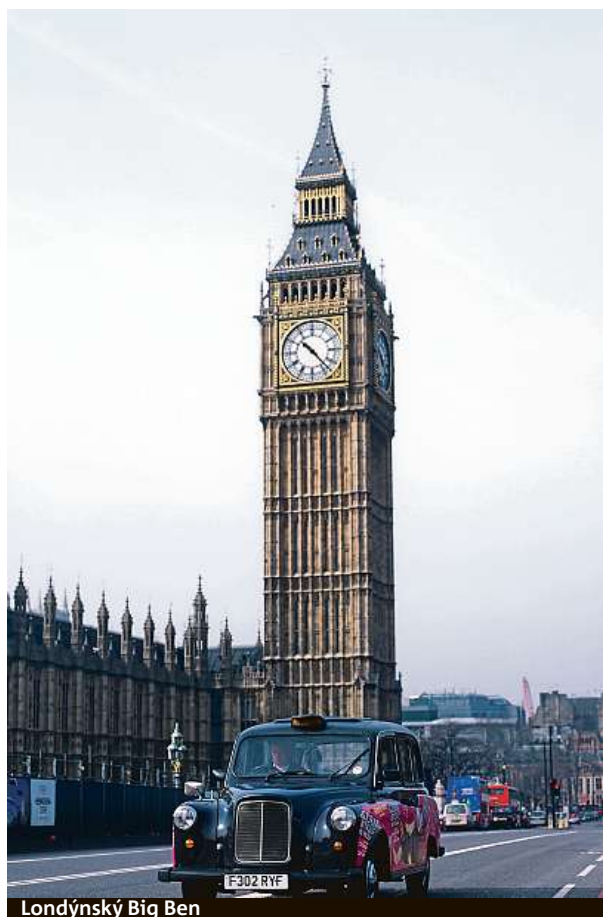
Londýnský Big Ben

Bílé zdi Tadž Mahalu ve městě Ágra čistí už od roku 2018. Letos dodělávají poslední zídky, ale podle serveru Indaffrica.co.nz by se to už fotekchtivých turistů nemělo dotknout. LUCIE MOTTLOVÁ