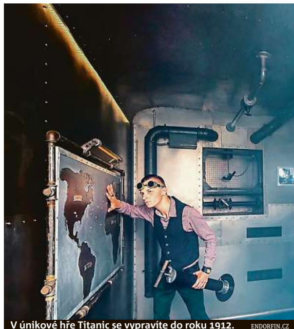
V únikové hře Titanic se vypravíte do roku 1912.