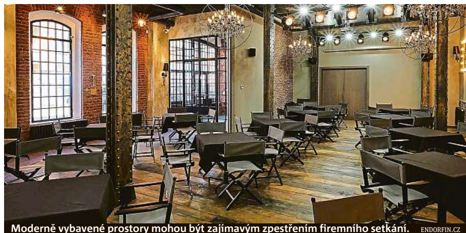
Moderně vybavené prostory mohou být zajímavým zpestřením firemního setkání. ENDORFIN.CZ