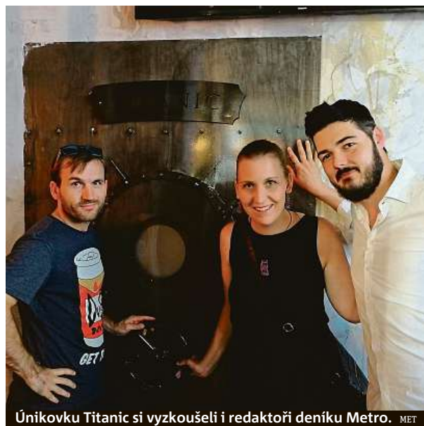
Únikovku Titanic si vyzkoušeli i redaktoři deníku Metro. MET