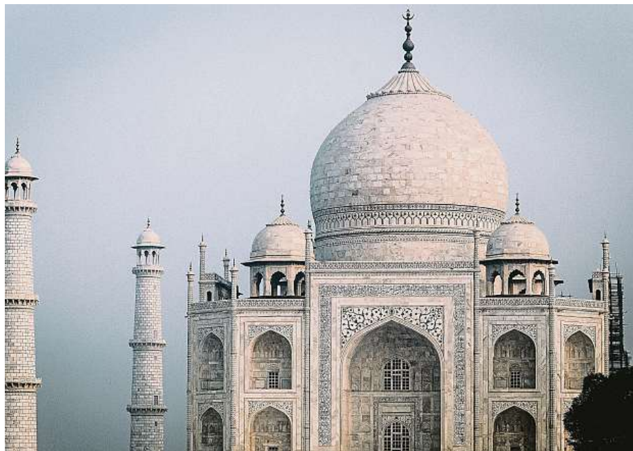
Tadž Mahal v Ágře

Slavný Park Güell prochází rekonstrukcí již od minulého roku. V současné chvíli se opravují mozaiky na stropě Sala Hipostila, který je částečně uzavřen. A také některé