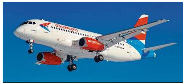
Letoun Suchoj Superjet 100

Stroj Suchoj Superjet 100 provozovaný leteckou společností Aeroflot, který odstartoval 5. května z moskevského letiště Šeremetjevo, se po půl hodině vrátil a pokusil se o nouzové přistání. Letadlo, na jehož palubě bylo 73 cestujících a pět členů posádky, na raněji vzplálo. Zahynulo 41 lidí. Přestože podle ruských