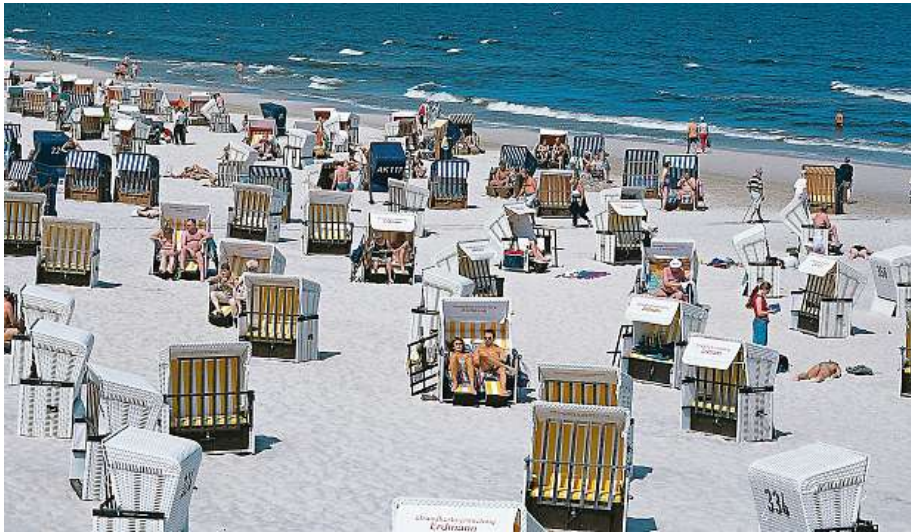
Plážové koše na německém ostrově Usedom.