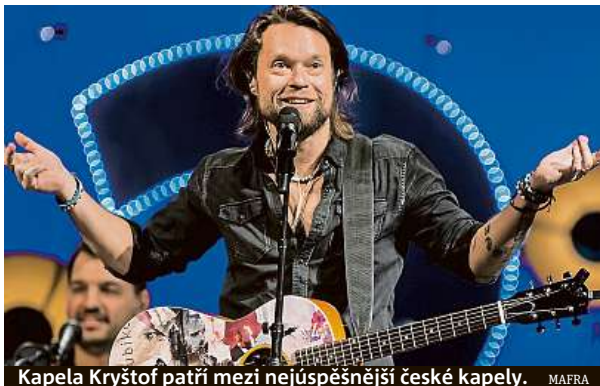
Kapela Kryštof patří mezi nejúspěšnější české kapely.

Patnáctý ročník festivalu Hradů CZ startuje v pátek a sobotu na hradě Točnicku a dále se vždy v pátek a sobotu představí na Kunětické hoře, Švihově, Rožmberku nad Vltavou, Vevří, Hradci nad Moravicí, Bouzově. Svoji letošní pouť uzavře na hradě Bezdězu. Páteční program na Točnicku nabídne koncerty Michala Hruzy, Arakainu a Lucie Bílé, Anny K. či kapely Rybičky 48. V sobotu se mohou fanoušci letní hradní tour těšit na kapelu Kryštof, která se na Hradů CZ vrací po šesti letech, Anetu Langerovou, Harlej, ale také Marpa & Trouble-gang nebo PSH a další interprety a skupiny. Festival u příležitosti půlkulatého jubilea apeluje na respekt k památkám i životnímu prostředí, v areálech se bude třídít odpad a kelímky na pivo budou vratné. V ceně lístku na festival je vždy vstup na konkrétní hrad zdarma. V pátek se areál na louce pod hradem Točnick se dvěma stagemi otevírá v půl čtvrté odpoledne