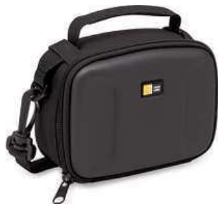
POUZDRO NA VIDEOKAMERU/ FOTOAPARÁT CASELOGIC MSEC4K