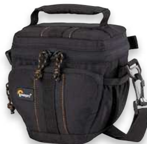
BRAŠNA NA FOTOAPARÁT LOWEPRO ADVENTURA TLZ 15