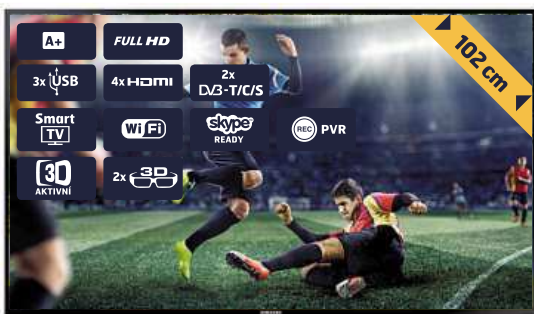
3D SMART FULL HD LED TELEVIZOR SAMSUNG UE40H6670

Více informací naleznete na www.DATART.cz/nejlepsi-doprava nebo u prodavačů.