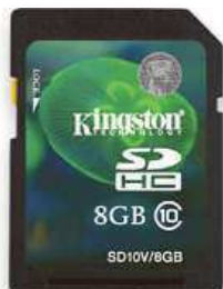
PAMĚŤOVÁ KARTA KINGSTON 8 GB SDHC CLASS 10 FLASH CARD kapacita 16 GB 419 Kč

Služba kryje poškození, loupež, vandalismus či přepětí, a k tomu i prodlouží záruku na 3 roky. více na DATART.cz/sluzby