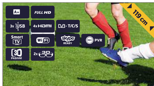
3D SMART FULL HD LED TELEVIZOR LG 47LB670V

obj. SMS kód 331692 19990 Kč nebo měsíčně minimálně* 1000 Kč