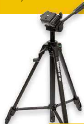
STATIV VELBON DF-40