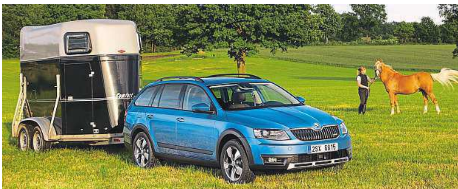
Tažné zařízení včetně přípravy stojí 17 tisíc.

Spotřeba proti minulé generaci klesla až o dvacet procent. Zkoušeli jsme benzínový turbomotor 1.8 TSI a nový silný diesel 2.0 TDI/135 kW – oba v kombinaci s automatickou převodovkou DSG a pohonem všech kol. U první verze výrobce udává spotřebu necelých sedm litrů benzínu na 100 km, my jsme při ostrém tempu jezdili za necelých devět. Diesel má polykat 5,1 l nafty, při našich zkouškách zahrnujících i jízdu v terénu jsme se dostali se syrovým motorem také o dva litry výš.