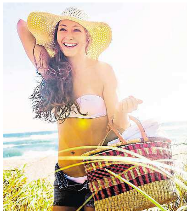
Vyrazte k vodě a nebojte se experimentovat.