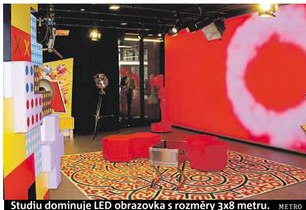
Studiu dominuje LED obrazovka s rozměry 3x8 metru. METRO