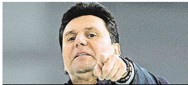
Zůstane Růžička trenérem hokejové reprezentace?