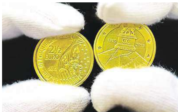
Nové belgické mince v hodnotě 2,5 eura