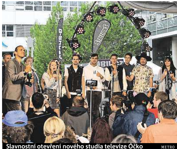
Slavnostní otevření nového studia televize Óčko METRO