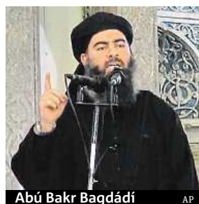
Abú Bakr Bagdádí

mi řidiči a to bez mobilních telefonů a další elektroniky, aby jejich pohyb nebylo možné zachytit. Důležitou roli ve skupině mají ženy členů IS včetně manželky Bagdádího. Právě ony si mezi sebou předávají ústně informace, které nechce IS svěřit elektronice.