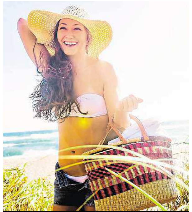
Vyrazte k vodě a nebojte se experimentovat.