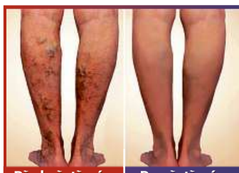
Před ošetřením Po ošetření

Kolik času vám zabere uvolnit se z pavoučí sítě?