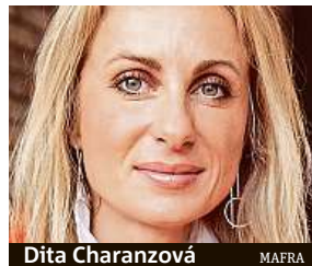
Dita Charanzová

Moc se nenuším. Jsem hyperaktivní člověk, v Bruselu se snažím žít hodně pracovně. Ráno pracovní snídaně, večer zase pracovní večere. V Bruselu jsem už čtyři roky pracovala, takže tam mám plno přátel a oblíbená místa. Pokud se nudím, chodím po