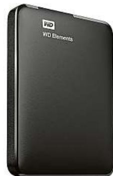
Externí disk od WD

v kapacitách 1–4 TB. S počítači se spojí pomocí rozhraní USB 3.0, přes které se zároveň napájí. Povrch disku je z černého plastu, který je lehký a zároveň relativně odolný. Léty prověřené technologie, vysoká kvalita výroby a použité materiály znamenají, že tyto disky jsou velmi spolehlivé. Ve specializovaném IT obchodě Mironet může být WD Elements Portable váš už od 1329 korun. Jako dárek zde navíc obdržíte originální ochranné neoprenové pouzdro v hodnotě 199 korun.