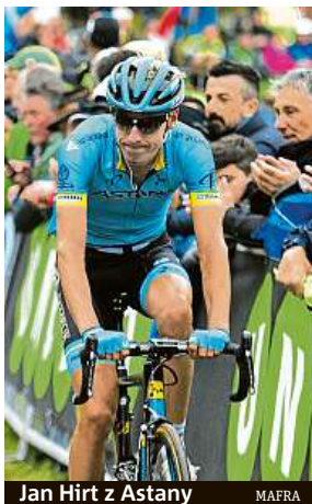
Jan Hirt z Astany MAIRA

Kromě Lópeze jsou favority Ital Vincenzo Nibali ze stáje Bahrain Merida, Brit Simon Yates z Mitchelton Scott či Ni-