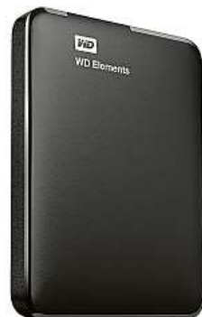
Externí disk od WD

v kapacitách 1–4 TB. S počítači se spojí pomocí rozhraní USB 3.0, přes které se zároveň napájí. Povrch disku je z černého plastu, který je lehký a zároveň relativně odolný. Léty prověřené technologie, vysoká kvalita výroby a použité materiály znamenají, že tyto disky jsou velmi spolehlivé. Ve specializovaném IT obchodě Mironet může být WD Elements Portable váš už od 1329 korun. Jako dárek zde navíc obdržíte originální ochranné neoprenové pouzdro v hodnotě 199 korun.