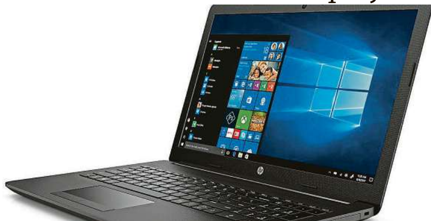
Zajímavý notebook od HP

Například notebook HP 250 G7 aktuálně patří mezi nejlépe prodávané notebooky na trhu. A aby také ne. V šedém těle, které neudělá ostudu v kanceláři, ve vlaku ani v přednáškovém sále, se skrývá úctyhodná výbava. Čtyřjádrový procesor Intel Core i5-8265U s taktkem až 3,9 GHz spolu s 4 GB operační pamětí rychle vyřeší každou