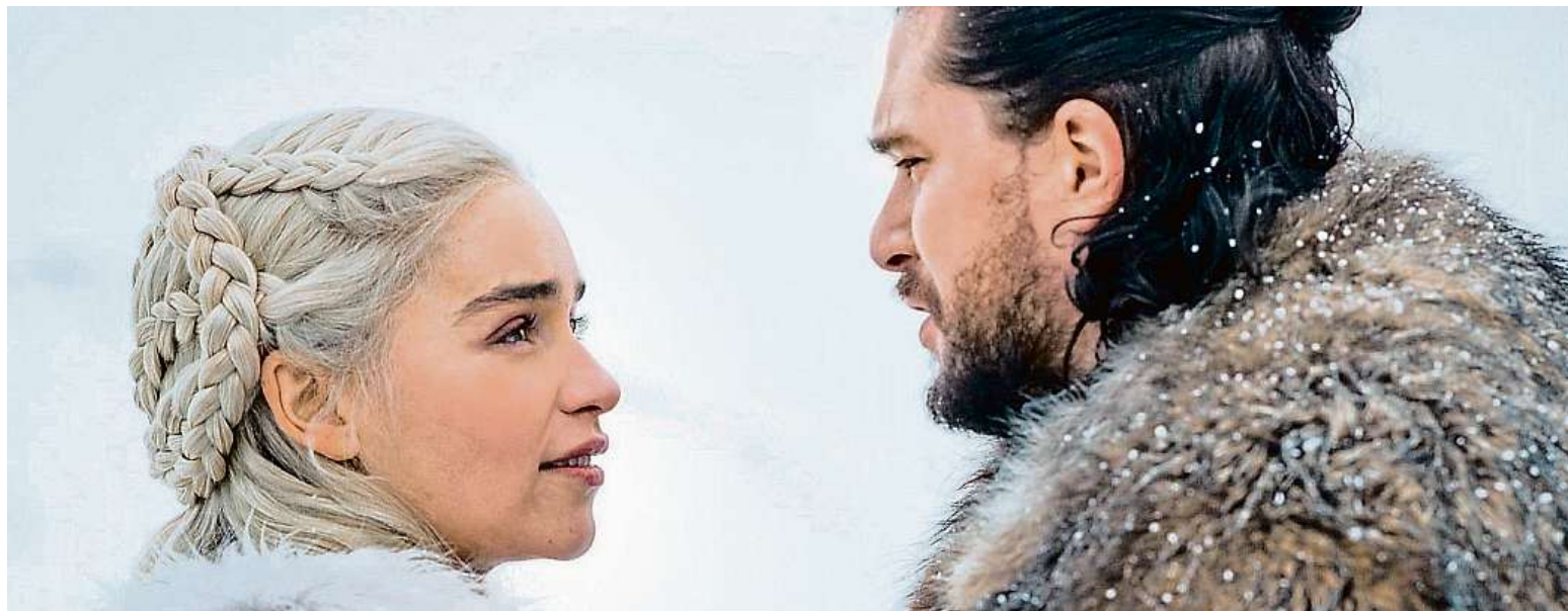
Daenerys a Jona Snowa uvidíme na obrazkách letos naposled. Se světem Hry o trůny ale jeho tvůrci zdaleka neskončili.