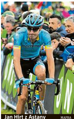
Jan Hirt z Astany

Kromě Lópeze jsou favority Ital Vincenzo Nibali ze stáje Bahrain Merida, Brit Simon Yates z Mitchelton Scott či Ni-