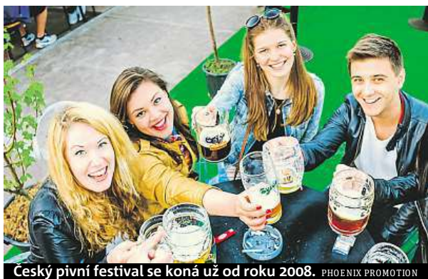
Český pivní festival se koná už od roku 2008.

Protože je v Česku pro doma uvařené pivo velmi přísná legislativa, připravil festival společný projekt s Cechem domácích pivovarníků a čtyřmi českými pivovary. Domácí sládcí tak svá piva měli možnost uvařit v opravdovém pivovaru. „Jsem hrdá na náš projekt Uvař si své pivo v pivovaru. Jeho prostřednictvím jsme čtyřem do-