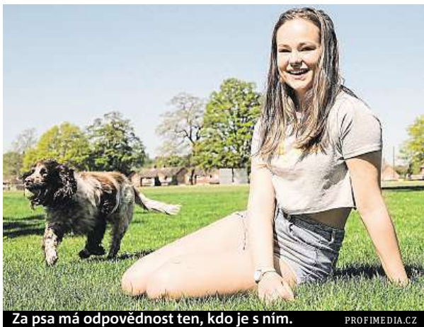
Za psa má odpovědnost ten, kdo je s ním.

„Strážník musí přestupce chytit ve chvíli, kdy si svou povinnost nesplní, tedy když po psovi neuklidí. Ten musí také souhlasit s uložení pokuty nebo napomenutím. Pokud nejsou tyto podmínky splněny, strážník celou věc oznamuje správnímu orgánu k dalšímu řešení,“ řekla deníku Metro mluvčí Irena Seifertová, podle které hříšníkově hrozí maximální pokuta de-