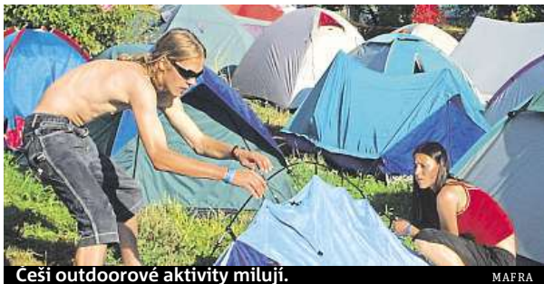
Češi outdoorové aktivity milují.

Za téměř tři měsíce (až do neděle 19. srpna) se v Letňanech představí více než 220 outdoorových značek. „Sortiment na výstavě se stále rozšiřuje, protože reagujeme na přání návštěvníků. Za posledních pět let se k nám přicházejí vybavit nejen turisté a lidé mířící do kempů či pod stan, ale přibývají také cestovatelé, outdooráři, lezci, spor-