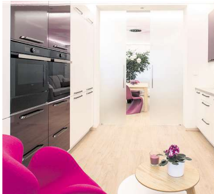
Celoskleněné posuvné dvoukřídlové dveře, sklo satináto

Celoskleněné dveře vnesou do interiéru přirozené denní světlo a členění prostoru dostane úplně jiný rozměr. Místnosti fyzicky oddělí a zároveň opticky propojí.