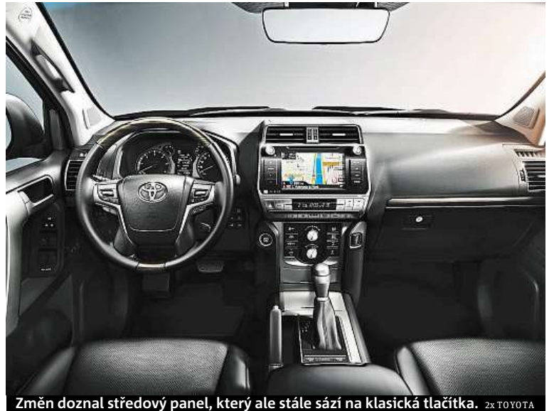
Změn doznal středový panel, který ale stále sází na klasická tlačítka. 2x TOYOTA