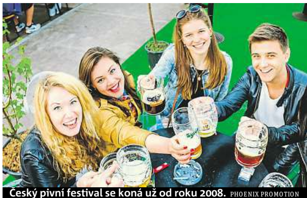
Český pivní festival se koná už od roku 2008. PHOENIX PROMOTION

Protože je v Česku pro doma uvařené pivo velmi přísná legislativa, připravil festival společný projekt s Cechem domácích pivovarníků a čtyřmi českými pivovary. Domácí sládcí tak svá piva měli možnost uvařit v opravdovém pivovaru. „Jsem hrdá na náš projekt Uvař si své pivo v pivovaru. Jeho prostřednictvím jsme čtyřem do-