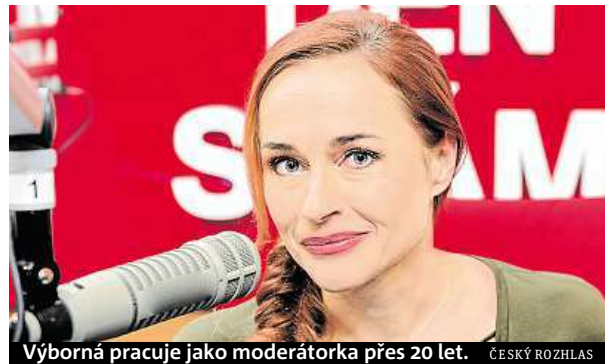
Výborná pracuje jako moderátorka přes 20 let. ČESKÝ ROZHLAS

Asi ta chvíle přímého přenosu. Ať už vystupujete v nějaké konkrétní události, nebo vám host ve studiu svěruje něco, o čem třeba předtím nikdy nemluvil. Ten fakt, že se to děje teď a tady, a také skutečnost, že se může stát cokoliv, neboť ani v životě neexistuje předem napsaný scénář.