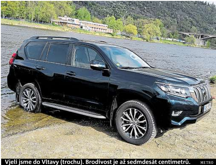
Vjeli jsme do Vltavy (trochu). Brodivost je až sedmdesát centimetrů. METRO