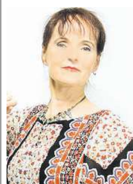
Jana Yngland Hrušková

Česká herečka, zpěvačka, moderátorka a aktivistka