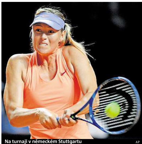
Na turnaji v německém Stuttgartu