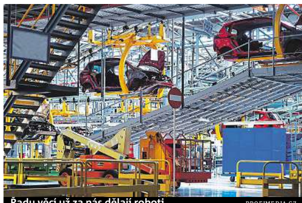
Řadu věcí už za nás dělají roboti.

S nástupem čtvrté průmyslové revoluce se trh digitalizuje a lidská práce je čím dál víc nahraditelná roboty. Začínají se tak objevovat hlasy, jestli není načase opět zkrátit počet pracovních dnů. „Kratší pracovní týden zní lákavě, ale pro Česko to je hudba budoucnosti. Toto opatření si může dovolit pouze stát se znalostní ekonomikou a výjimečnou efektivitou práce s extrémně vysokou přídavnou hodnotou. Robotizace se sice ubírá tímto směrem, ale do stavu snížení počtu pracovních dnů máme opravdu