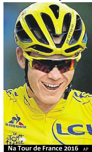
Na Tour de France 2016

Britský cyklista Chris Froome vyvázl bez zranění z nehody při včerejším tréninku v Monaku. Trojnásobný šampion Tour de France si na Twitteru postěžoval, že do něho úmyslně najel netrpělivý řidič. „Naschvál mě srazil netrpělivý řidič, který mě sledoval až na chodník,“ tweetoval 31letý Brit spolu s fotografií zničeného kola. „Díkybohu jsem v pořádku. Kolo je na odpis. Řidič ujel,“ doplnil kapitán stáje Sky na sociální síti. K incidentu došlo necelé tři týdny poté, co po srážce s dodávkou zemřel při tréninku italský cyklista Michele Scarponi, vítěz Gira z roku 2011. ČTK