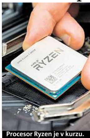
Procesor Ryzen je v kurzu.

Druhý největší výrobce desktopových procesorů AMD se musel v poslední dekádě krčit ve stínu svého konkurenta z kalifornského Silicon Valley – společnosti Intel. Všechny jeho pokusy o vzkříšení dopadly mírně řečeno nevalně a ani donedávna nic nenasvědčovalo světlejším zítřkům. Stalo se ale něco, co čekal jen málokdo. V AMD se rozhodli pro radikální změny ve vývoji, ohlásili novou generaci procesorů s označením Ryzen, vyráběnou 14nm procesem. A světe, div se – AMD je zpět v plné síle.