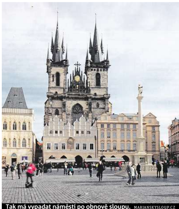
Tak má vypadat náměstí po obnově sloupu. MARIANSKYSLOUP.CZ

Včera proběhlo na radnici Prahy 1 veřejné projednání žádosti o územní rozhodnutí, jedna z podmínek pro získání stavebního povolení. Proti záměru nepadla žádná faktická připomínka, pouze spolek Exulat, společnost Veritas a Čs. církev husitská vznesly své námítky písemně, ty ale byly více historické a ideologické než podle stavebního zákona. Proti obno-