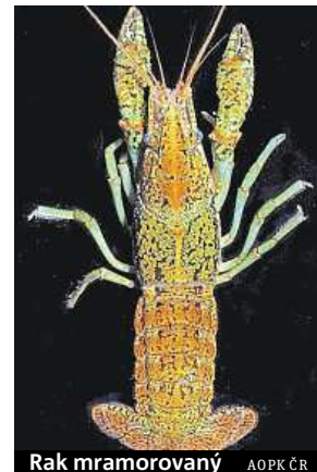
Rak mramorovaný AOPK ČR

Nebezpečné přenašeče račího moru vyhnala radnice z parku Přátelství.