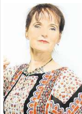
Jana Yngland Hrušková

Česká herečka, zpěvačka, moderátorka a aktivistka