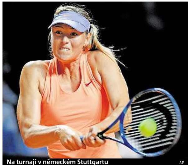
Na turnaji v německém Stuttgartu

Turnaj v anglickém Birminghamu už Šarapovová dvakrát vyhrála, a to v letech 2004 a 2005. Naposledy v roce 2010 nestačila ve finále na Číňanku Li Na. DNES.cz