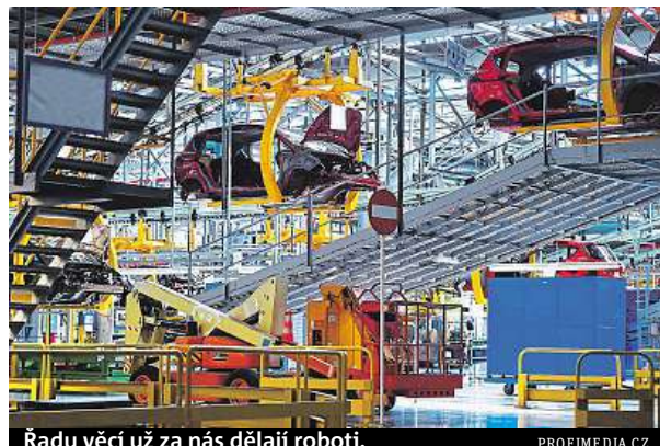
Radu věcí už za nás dělají roboti.

S nástupem čtvrté průmyslové revoluce se trh digitalizuje a lidská práce je čím dál víc nahraditelná roboty. Začínají se tak objevovat hlasy, jestli není načase opět zkrátit počet pracovních dnů. „Kratší pracovní týden zní lákavě, ale pro Česko to je hudba budoucnosti. Toto opatření si může dovolit pouze stát se znalostní ekonomikou a výjimečnou efektivitou práce s extrémně vysokou přídavnou hodnotou. Robotizace se sice ubírá tímto směrem, ale do stavu snížení počtu pracovních dnů máme opravdu