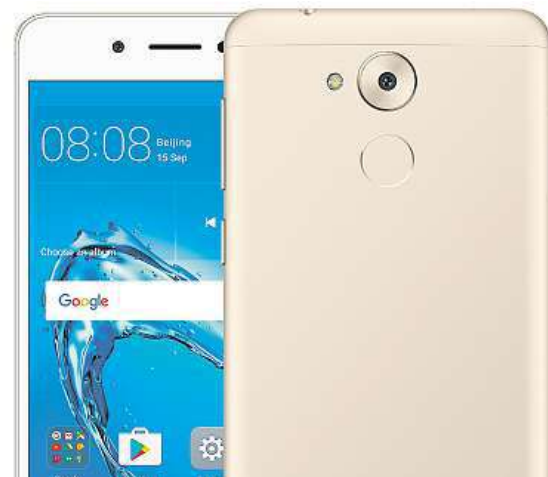
Huawei Nova Smart

Pokud vás novinka Huawei Nova Smart přesvědčila o svých kvalitách už teď, připočtete ještě podporu dvou SIM karet nebo všech důležitých LTE frekvencí, a o vašem přístupu k novému telefonu se zdá být jasno.