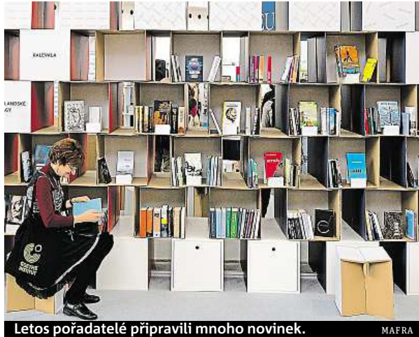
Letos pořadatelé připravili mnoho novinek.

Program bude probíhat rovněž v nové literární vzducholoď Gulliver, kam budou moci zájemci přijít i díky su-