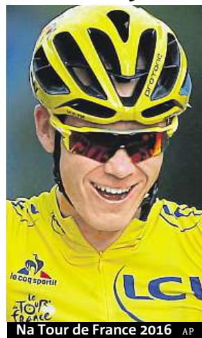
Na Tour de France 2016

Britský cyklista Chris Froome vyvázl bez zranění z nehody při včerejším tréninku v Monaku. Trojnásobný šampion Tour de France si na Twitteru postěžoval, že do něho úmyslně najel netrpělivý řidič. „Naschvál mě srazil netrpělivý řidič, který mě sledoval až na chodník,“ tweetoval 31letý Brit spolu s fotografií zničeného kola. „Díkybohu jsem v pořádku. Kolo je na odpis. Řidič ujel,“ doplnil kapitán stáje Sky na sociální síti. K incidentu došlo necelé tři týdny poté, co po srážce s dodávkou zemřel při tréninku italský cyklista Michele Scarponi, vítěz Gira z roku 2011. ČTK