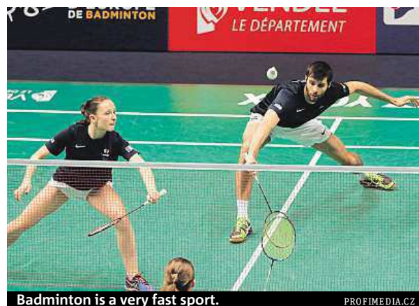
Badminton is a very fast sport.

Activity 1. False; 2. True; 3. True; 4. True; 5. True; 6. False