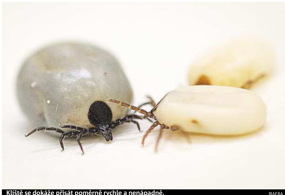
Klíště se dokáže přisát poměrně rychle a nenápadně.

V Česku jsou podle ní tyto změny zřejmé, klíšťata se