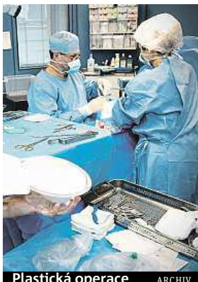
Plastická operace ARCHIV

„Tuto operaci si ve větším počtu v posledních letech dopřávají i mladší ročníky. U nejmladší věkové kategorie osmnáct až dvacet pět let se