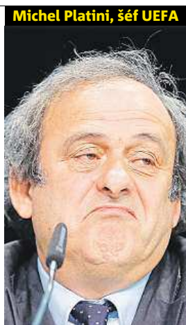
Michel Platini, šéf UEFA V čele Evropské fotbalové asociace je od roku 2007.

Arbitráž uznala, že mezi Platinim a FIFA byla v roce