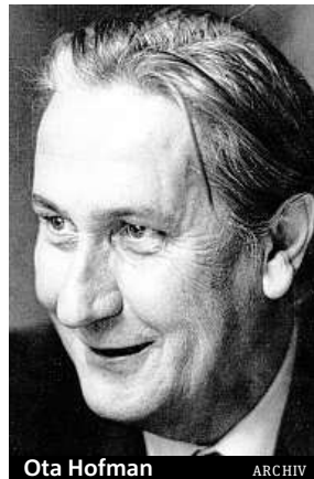
Ota Hofman ARCHIV