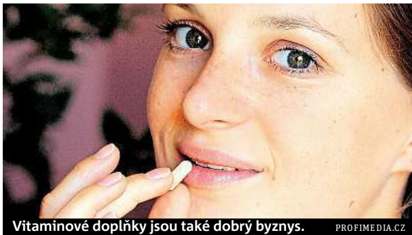
Vitamínové doplňky jsou také dobrý byznys.

Každý vitamin ale funguje jen s podpůrnými látkami. „Například železo se mnohem lépe vstřebává s vitamínem C. Ale B12 a B6 se musí podávat společně, aby to bylo