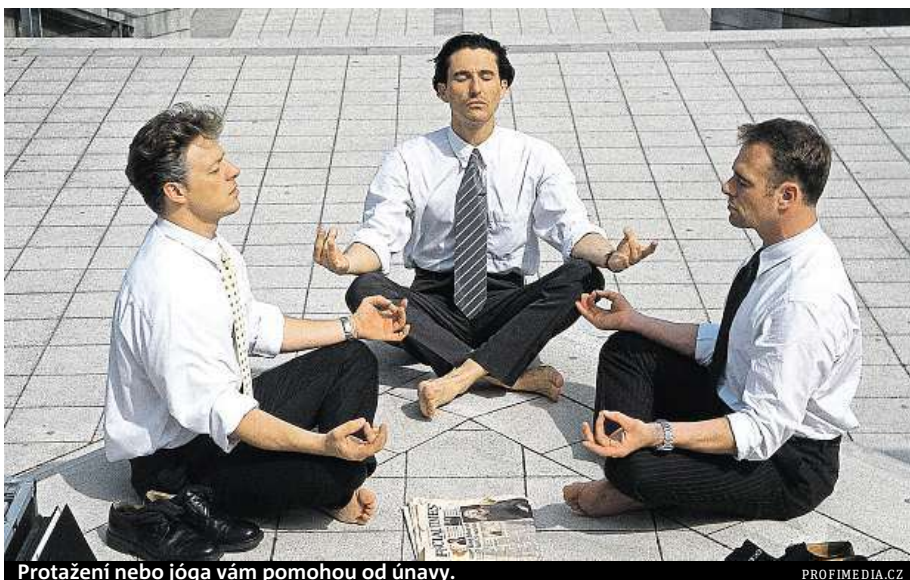
Protahení nebo jóga vám pomohou od únavy.

„Únavu výrazně omezíte tím, když si budete během pracovní doby dělat krátké přestávky. Velmi relaxačně působí protažení zad se záklonem