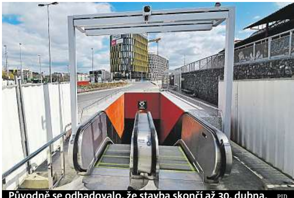
Původně se odhadovalo, že stavba skončí až 30. dubna. PID

Absenci eskalátorů, které zde od otevření metra v dubnu 2015 zoufale chyběly, řeši-