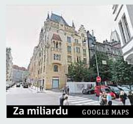
Za miliardu GOOGLE MAPS

Možná i více než jednu miliardu korun utrží saúdskoarabský majitel domu číslo 15 na rohu Pařížské a Široké na pražském Starém Městě. Jednalo by se o nejdražší prodej obytného domu v hlavním městě. Nedaleko tohoto objektu se nyní rekonstruuje další bytová nemovitost, metr čtvereční by zde měl vyjít na 400 tisíc korun. Což je cena staršího domku mimo hlavní realitní oblasti v Česku.