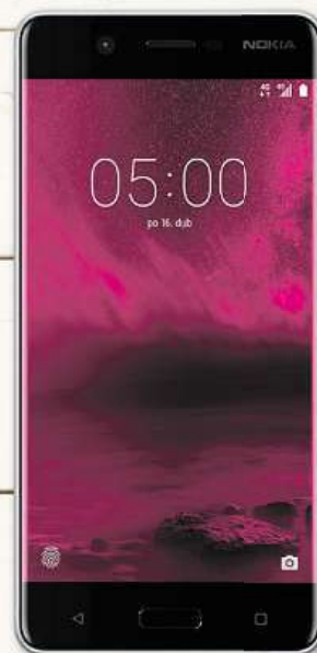
Nokia 5 k tarifu L za 1 Kč