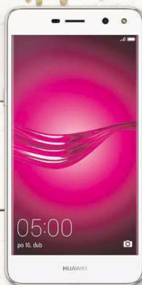
Huawei Y6 2017 k tarifu M za 1 Kč