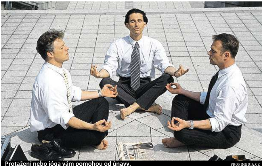
Protahení nebo jóga vám pomohou od únavy.

„Únavu výrazně omezíte tím, když si budete během pracovní doby dělat krátké přestávky. Velmi relaxačně působí protažení zad se záklonem