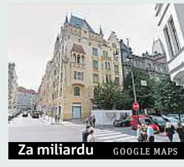
Za miliardu GOOGLE MAPS

Možná i více než jednu miliardu korun utrží saúdskoarabský majitel domu číslo 15 na rohu Pařížské a Široké na pražském Starém Městě. Jednalo by se o nejdražší prodej obytného domu v hlavním městě. Nedaleko tohoto objektu se nyní rekonstruuje další bytová nemovitost, metr čtvereční by zde měl vyjít na 400 tisíc korun. Což je cena staršího domku mimo hlavní realitní oblasti v Česku.