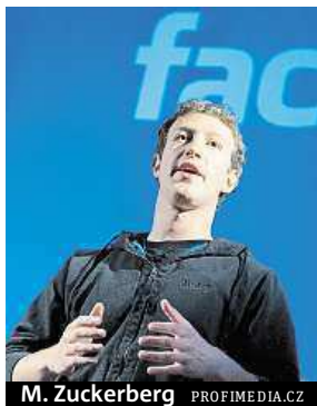
M. Zuckerberg

Hromadné žaloby na sociální síť se účastní i zhruba stovka Čechů.