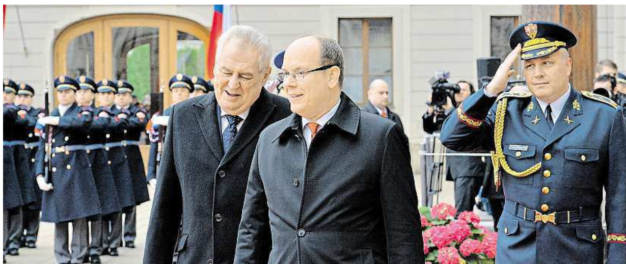
Monacký kníže Albert II. (uprostřed, vlevo prezident Zeman) včera oficiálně zahájil návštěvu Česka. Více na straně 4

Beztrestnost. Do roku 2009 byla zaručena těm, kdo se přiznali, že upláceli nebo úplatek přijali. Novela trestního řádu. Vrací beztrestnost do hry. Změny. Trestná bude už i příprava na krácení daní STRANA 4