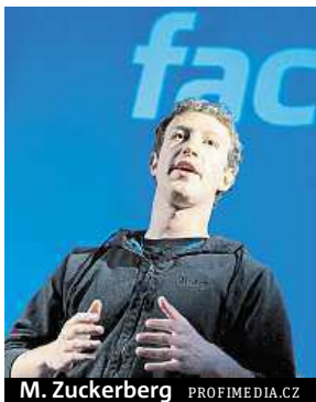
M. Zuckerberg

Hromadné žaloby na sociální síť se účastní i zhruba stovka Čechů.