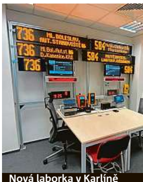
Nová laborka v Karlíně

„Jedná se o testovací laboratoř středočeského organizátora dopravy IDSK. Hlavní město, respektive pražský organi-