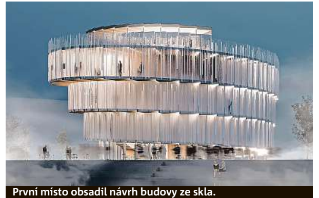
První místo obsadil návrh budovy ze skla.

Další částí vize je také to, že se jako společnost budeme dožívat vyššího věku v plné síle. „K posílení vnitřní vitality si potřebujeme uvědomovat i společenské a kulturní hodnoty, neustále si je připomínat a posilovat. Proto pavilon ze dřeva a skla, řemeslně a kreativně pojatý, naplněný českým umem a kreativitou. Ve tvaru dynamické spirály jako té nejdělnější cesty,“ uzavírá Slovákova. MET