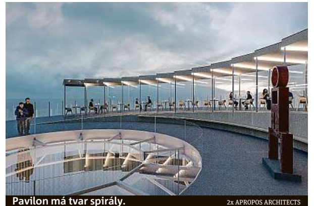
Pavilon má tvar spirály.