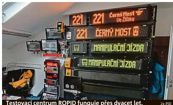
Testovací centrum ROPID funguje přes dvacet let.

Laboratoř odbavovacích a informačních systémů umožňuje podle mluvčího IDSK Oldřicha Buchetky vyzkoušení odbavení cestujících, tedy výdej libovolného jízdního dokladu. Dále také chování informačních systémů, tabel na autobusech, LCD monitorů s informacemi