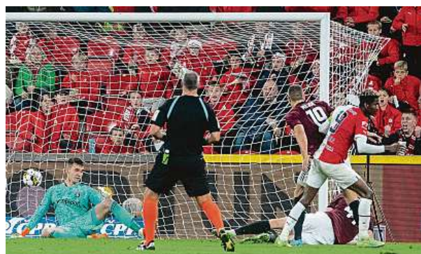
V zatím posledním derby Slavia porazila Spartu 4:0.