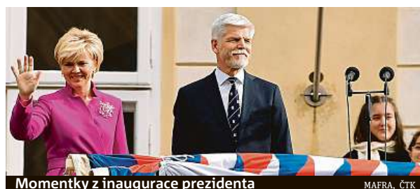
Momentky z inaugurace prezidenta