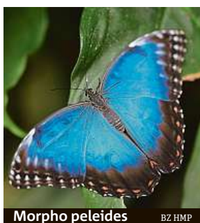
Morpho peleides BZ HMP