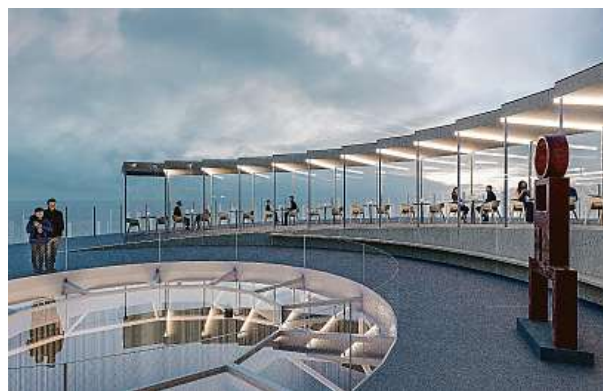
Pavilon má tvar spirály.