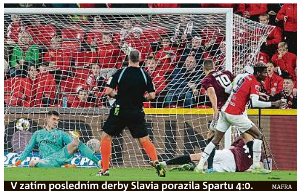
V zatím posledním derby Slavia porazila Spartu 4:0.