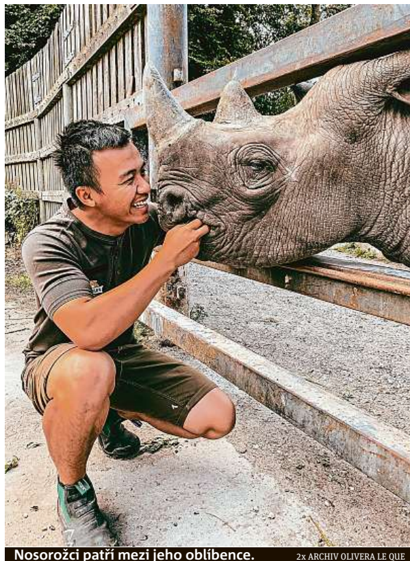
Nosorožci patří mezi jeho oblíbence.

Jelikož žije v Plzni, spolupracoval s východočeskou zoo nejprve necelý rok na dálku. Protože se ale osvědčil, tak mu instituce nabídla práci