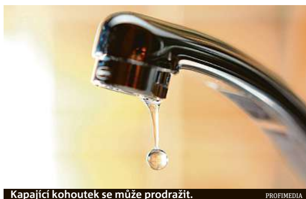
Kapající kohoutek se může prodražit.

„Největší spotřebu vody dělá splachování,“ uvádí Tereza Kovalčíková, majitelka