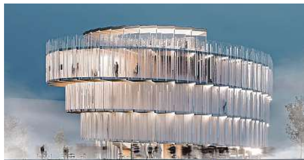
První místo obsadil návrh budovy ze skla.

Další částí vize je také to, že se jako společnost budeme dožívat vyššího věku v plné síle. „K posílení vnitřní vitality si potřebujeme uvědomovat i společenské a kulturní hodnoty, neustále si je připomínat a posilovat. Proto pavilon ze dřeva a skla, řemeslně a kreativně pojatý, naplněný českým umem a kreativitou. Ve tvaru dynamické spirály jako té nejideálnější cesty,“ uzavírá Slováková. MET