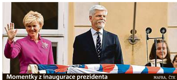
Momentky z inaugurace prezidenta