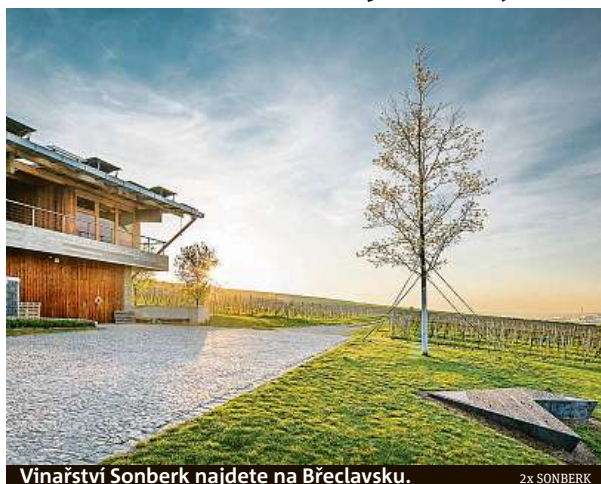
Vinařství Sonberk najdete na Břeclavsku.