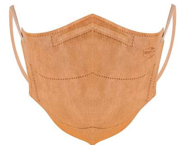
Respirátor VK RespiPro

Elektrostatický náboj se totiž vybíjí vlhkostí. Proto přestává klasický respirátor fun-