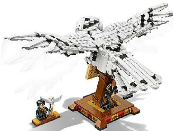
Sova Hedvika ze stavebnice Lego Harry Potter

Stavebnice Lego Harry Potter se sovou Hedvikou zakoupíte aktuálně v internetovém obchodu Mironet.cz za 940 korun.