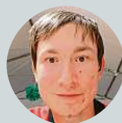
Beneš Táda Vir nepodceňuji, ale opatření jsou nesmyslná, nefunkční.