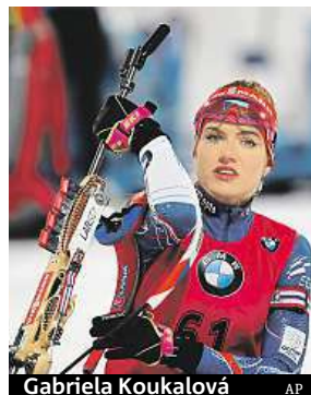
Gabriela Koukalová

Biatlonistka Laura Dahlmeierová se o vikendu s předstihem může stát nástupkyní Gabriely Koukalové.