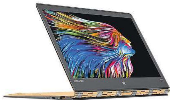
Lenovo YOGA 900 MIRONET

Připočteme-li k tomu výdrž baterie dlouhou až 10,5 hodiny, pro časté přenášení a práci na cestách budete jen těž-