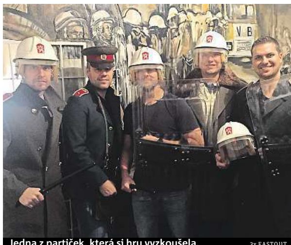
Jedna z partiček, která si hru vyzkoušela.

„Místnosti jsme upravili podle skutečných informací od pamětníků z řad Veřejné bezpečnosti. Řekli nám, jak