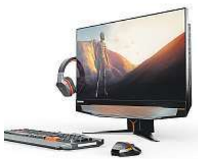
Lenovo Y910-27ISH MIRONET

Tentokrát se zaměřilo na hráče, kterým přináší komplexní herní stroj v All in One provedení. Dámy, pánové a vášniví hráči, seznamte se – Lenovo Y910-27ISH.