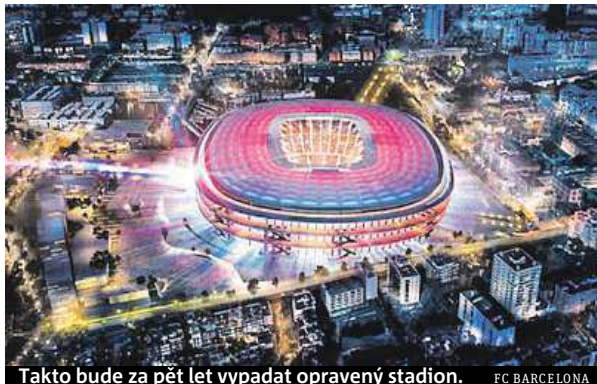
Takto bude za pět let vypadat opravený stadion. FC BARCELONA

Veřejná prezentace představby proběhne v příštích týdnech. „Vítězný návrh byl