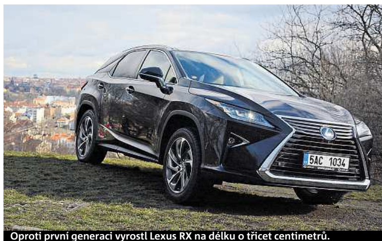
Oproti první generaci vyrostl Lexus RX na délku o třicet centimetrů.