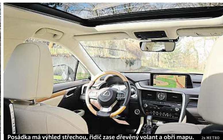
Posádka má výhled střechou, řidič zase dřevěný volant a obří mapu. 2x METRO

Samuraj, elegán a hybrid k tomu. Jedno z nejlepších luxusních SUV má dvě písmena – RX.