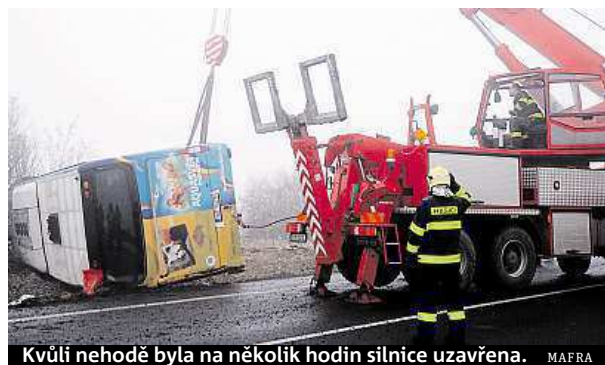
Kvůli nehodě byla na několik hodin silnice uzavřena.

Dvě vážně zraněné děti ročníku 2005 a 2006 přijala motolská nemocnice. Nejvážněji zraněné dítě museli záchranáři napojit na umělou plicní ventilaci. „Je na ARO, jeho stav je vážný, ale nemělo by být v ohrožení života,“ řekla odpoledne mluvčí pražské záchranky Jiřina Ernestová. Autobus mířil s dětmi na výlet z Vejprtu do Prahy. MAP