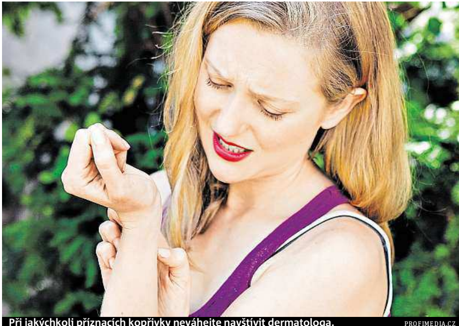
Při jakýchkoli příznacích kopřivky neváhejte navštívit dermatologa.

Pupeny mohou být načervenalé, ve středu bledší. Až u třetiny případů je doprovázen svědivý otok. „Ten mizí vět-