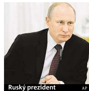
Ruský prezident

Ruská televizní stanice Rossiya 1 zveřejnila ukázkou z filmu, ve kterém prezident Vladimir Putin popisuje, jak ruské bezpečnostní složky před rokem dostaly za úkol dostat z Ukrajiny sesazeného prezidenta Viktora Janukovyče. Putin v traileru rovněž zmiňuje, jaké byly přípravy začlenění ukrajinského poloostrova Krym do Ruska. ČTK