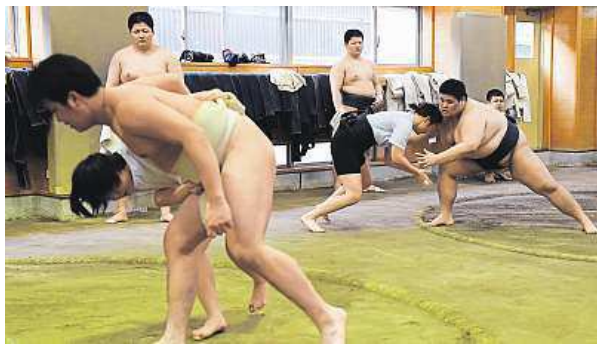
Těžko na cvičišti, lehký na bojišti

O sumu panují předsudky, že to je sport obézních mužů. To chce Japonsko změnit.