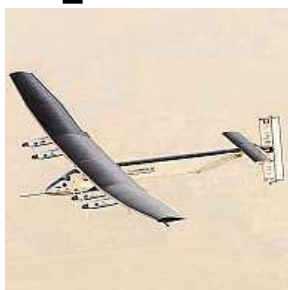
Solar Impulse 2