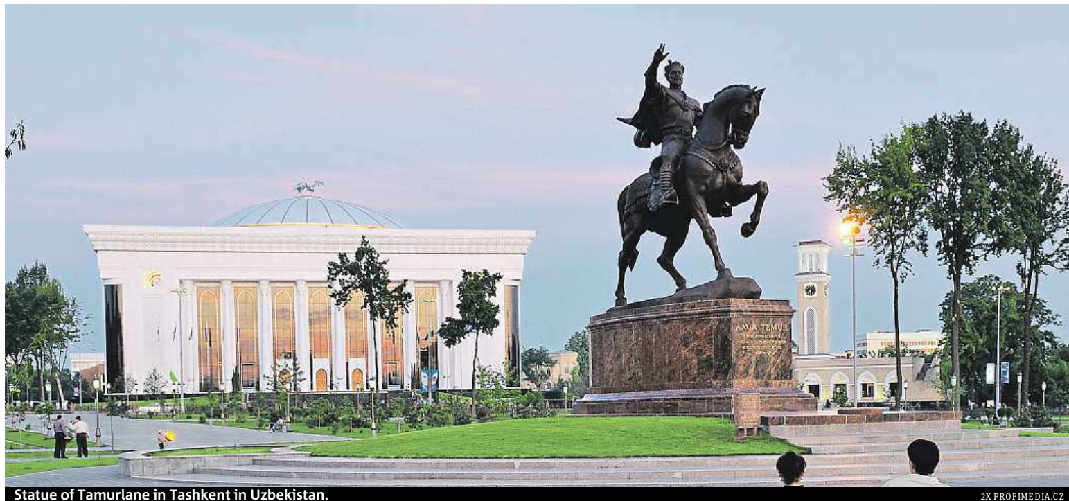
Statue of Tamurlane in Tashkent in Uzbekistan.