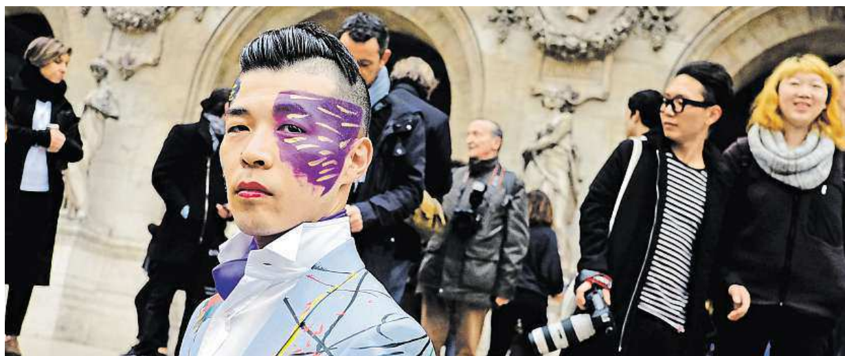
Módní nadšenec včera navštívil pařížskou přehlídku Stelly McCartneyové, dcery slavného exbeetla Paula.

Úspora. Letenka koupená s několikaměsíčním předstihem může být až o třetinu levnější. Eurovikendy. Na pár dnů míříme do Londýna či Paříže. Exotika. Nejvíce lákají Emiráty, kde se už nemusí platit za víza STRANA 5