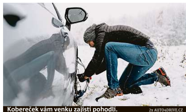
Kobereček vám venku zajistí pohodlí.