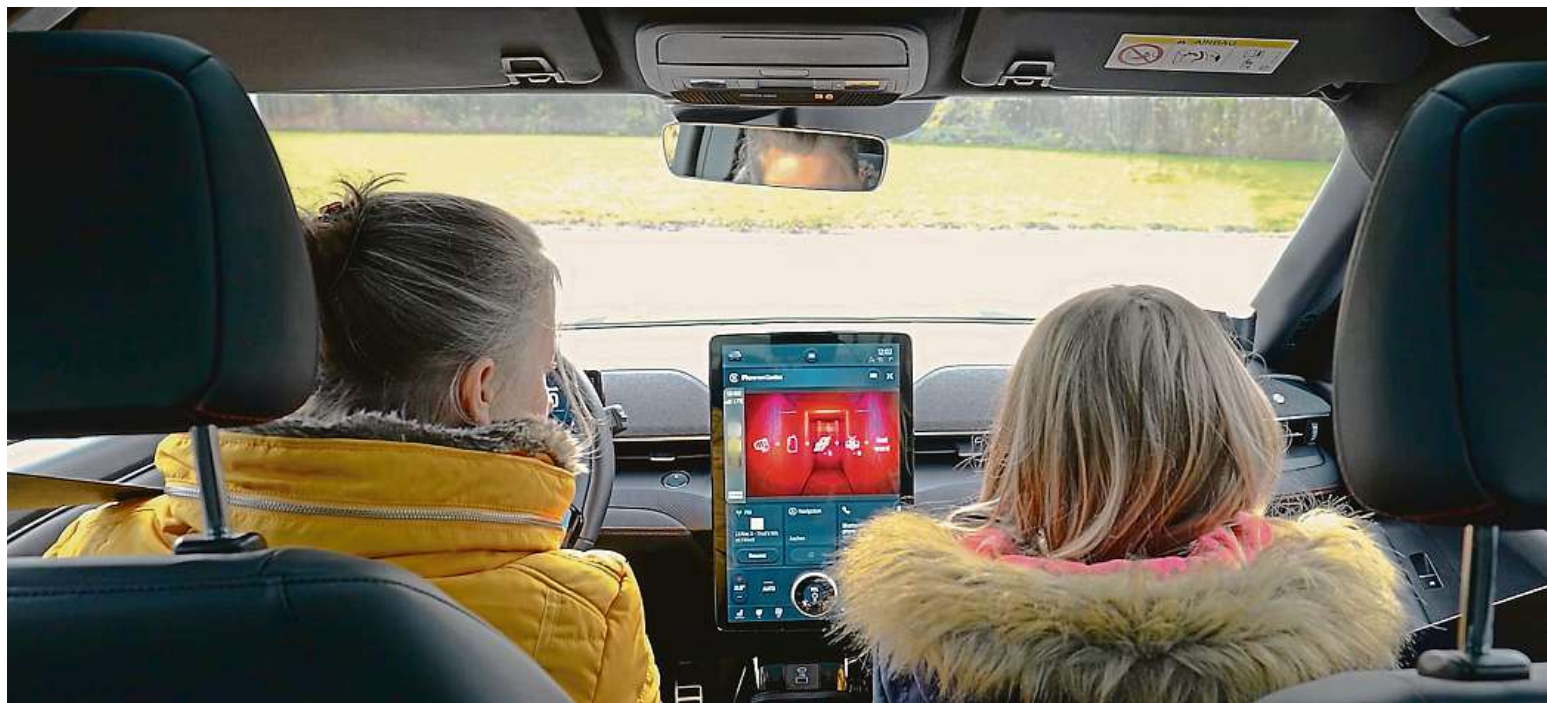
Samotná hra je instalována na zařízení s operačním systémem iOS. S vozem komunikuje prostřednictvím Apple CarPlay a hardwaru i softwaru od Fordu. FORD