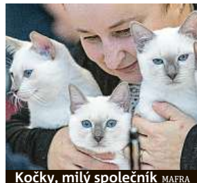
Kočky, milý společník MAFRA

Pyšné lidstvo může závidět i neandertálcům.