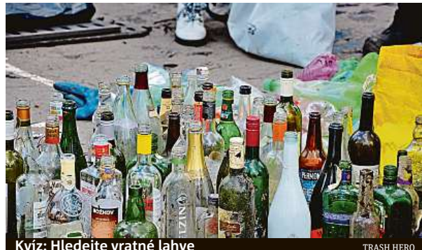
Kvíz: Hledejte vratné lahve

Alespoň internetová populace, především mladší generace, se v průzkumu výrazně zasazuje za zavedení výkupu vratných plechovek a lahví typu PET. V této skupině má finanční záloha za uvedené nápojové obaly podporu více než osmdesát procent respondentů. Pětina lidí by je dokonce zálohovala částkou deset korun místo uvažovaných tří korun. PAVEL HRABICA