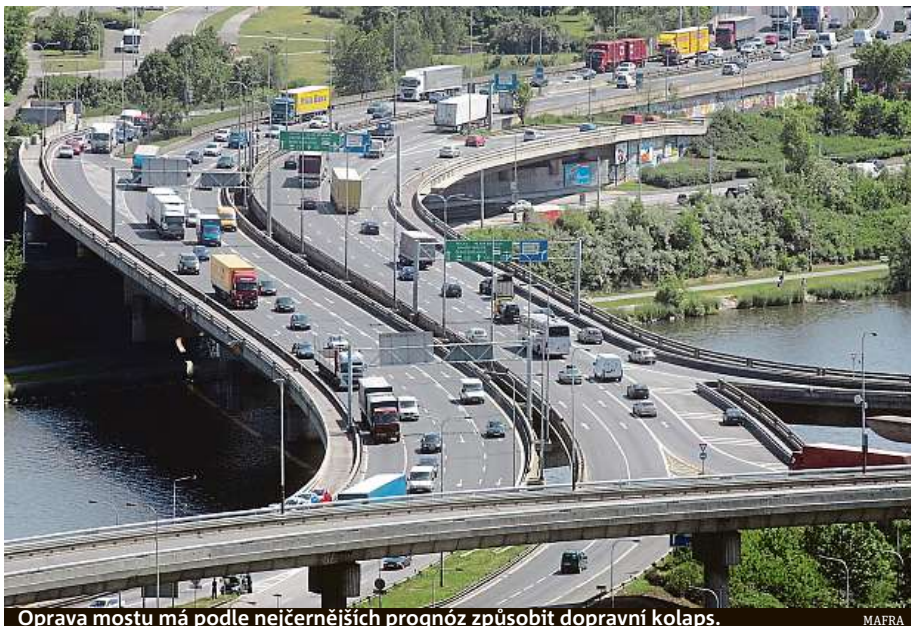
Oprava mostu má podle nejčernějších prognóz způsobit dopravní kolaps.

Je mi to líto. Když jsme ho v roce 1983 stavěli, snažili jsme se dát do toho to vůbec nejlepší, co jsme tenkrát měli k dispozici. Jen pro představu, některé materiály jsme vozili z Belgie. To byl za socialismu opravdu zážrak. Tehdy byl problém sehnat kvalitní izolace i cement. Asfalt byl špatný a lámal se. Kdybychom to ale tehdy neudělali kvalitně, kompletní oprava se nedělá dnes, ale už před patnácti lety.