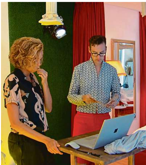
Natáčení v Anybody hotelu