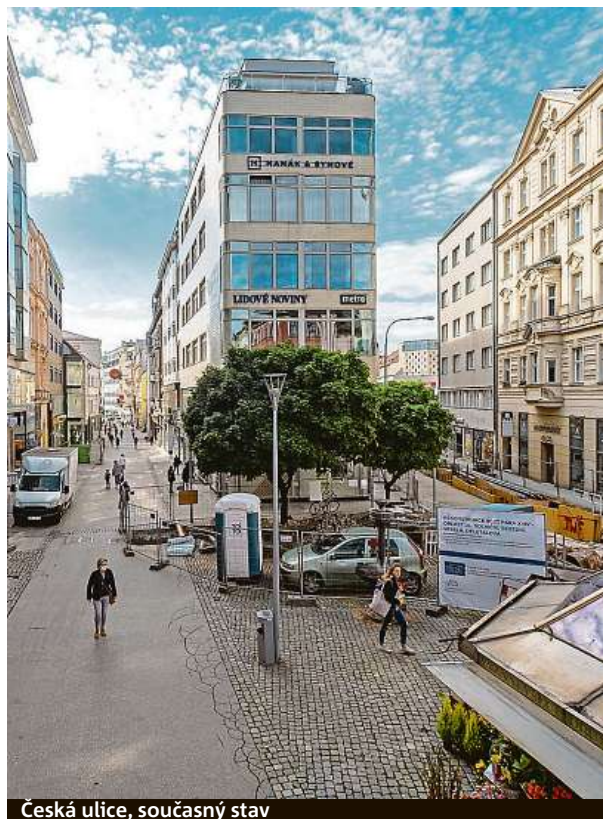
Česká ulice, současný stav

Nutné je pečlivě vybírat jednotlivé prvky nového povrchu. Dlaždice musí ladit.