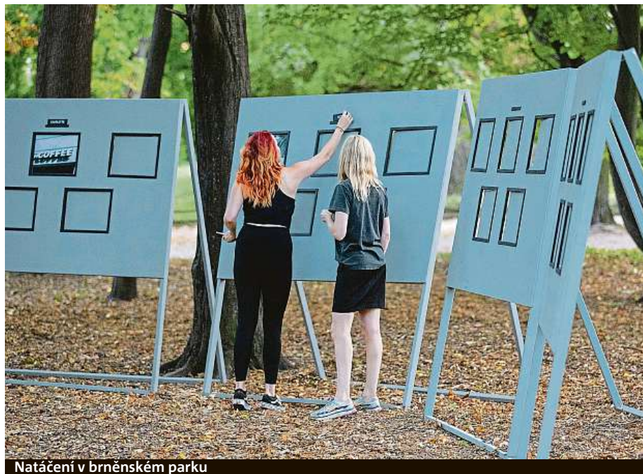
Natáčení v brněnském parku

Brno tvořilo kulisy i pro část dalšího dílu série. „Při přípravě i samotném natáčení se projevila synergie mezi veřejným a soukromým sektorem, kterou se nám podařilo vybudovat a kterou dokážeme využít při prezentaci Brna. Zároveň je vidět, jak skvěle může podporovat ces-