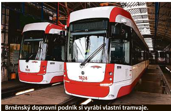
Brněnský dopravní podnik si vyrábí vlastní tramvaje.

Nové vozy už v brněnských ulicích najedly přes sto tisíc kilometrů, především na lince číslo 4, která projíždí středem města. „Oceňuji, že i v době boje s epidemií koronaviru se podařilo uvést do provozu všech devět vozů podle původního plánu. Tramvaje Drak díky své špičkové kvalitě a v neposlední řadě i díky jménu a červeno-bílému provedení dělají městu