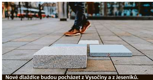
Nové dlaždice budou pocházet z Vysočiny a z Jeseníků.