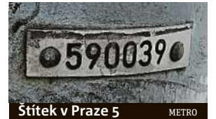
Štítek v Praze 5 METRO

Po načtení QR kódu mobilním telefonem totiž dojde k přesměrování na novou webovou aplikaci s názvem Skenujprahu.cz, která bude integrovat nejrůznější data a služby. PAVEL URBAN