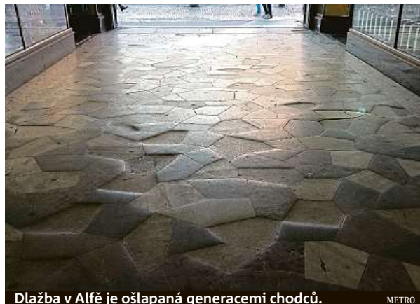
Dlažba v Alfě je ošlapaná generacemi chodců.