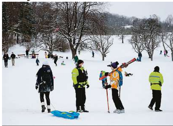
Strážníci včera vše řešili domlouvu, pokuty nedávali.