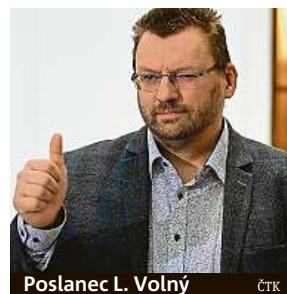
Poslanec L. Volný

Předseda Sněmovny Radek Vondráček ze včerejší schůze vykázal z jednacího sálu nezařazené poslance Lubomíra Volného a Mariana Bojka. Neměli nasazené roušky a nenasadili si je ani na jeho výzvu. Vondráček je poté nechal vyvést ze sálu, přerušil kvůli tomu jednání. Ochranářská služba je po několika minutách vyvedla. Oba poslanci již dříve oznámili, že odmítají nosit ve Sněmovně roušku, a to, jak uvedli, z občanských a politických důvodů. Uvnitř Sněmovny je nošení roušky povinné. Vondráček nejprve označil chování obou poslan-