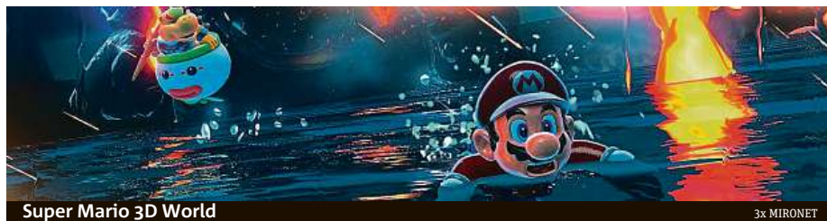
Super Mario 3D World