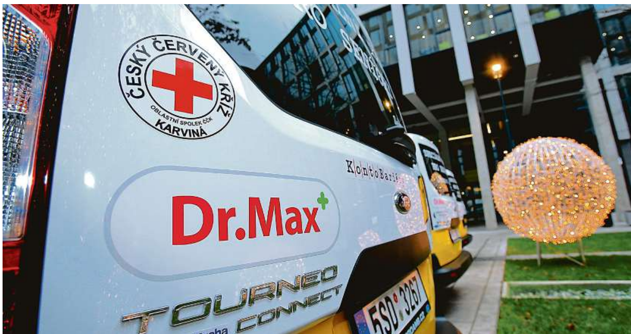
V Orlové bude Taxík Maxík provozovat karvinský Červený kříž.

Letos vyjíždějí do ulic dalších tří obcí vozy speciální autodopravy pro seniory, které poskytuje Konto Bariéry Nadace Charty 77 díky sponzorství největší české sítě lékáren. Projekt Taxík Maxík funguje už od roku 2016.