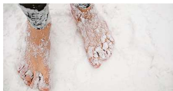
Začněte pomalu, neskákejte hned do studené řeky.

Přibližně po patnácti dnech se tělo na působení chladu adaptuje. „Parametry buněčné imunity se normalizují a časem dochází k jejich zvýšení nad původní úroveň. Důležitá je ale pravidelnost a průměrnost. Jestliže to přezene, stane se opak toho, čeho chceme docílit, a chlad na nás bude působit negativně a stresově se všemi svými důsledky,“ varuje fyzioterapeutka Iva Bílková. KAMILA HUDEČKOVÁ