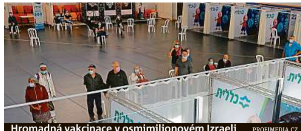
Hromadná vakcinace v osmimilionovém Izraeli

„Většina z rizikových skupin už procesem prošla,“ vítá epidemioložka Kalanit Kayeová. „Problém jsou ale mladí lidé, kteří si neuvědomují důležitost vakcíny a věří dezinformacím,“ krčí rameny odbornice, jež zdůrazňuje, že pro vytvoření kolektivní imunity je třeba proočkovat nejméně 70 a více procent obyvatel.