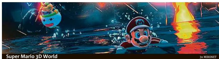
Super Mario 3D World