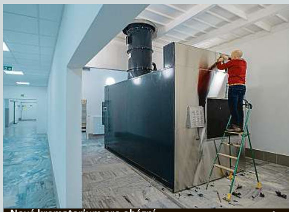
Nové krematorium pro obézní