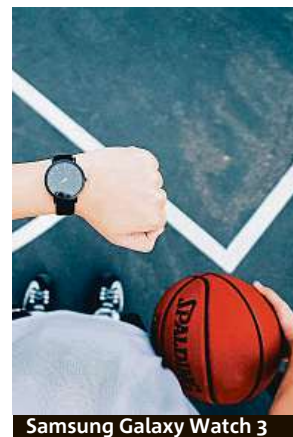
Samsung Galaxy Watch 3

Neváhejte tedy a zamiřte do internetového obchodu Mironet.cz, kde najdete prémiové chytré hodinky značky Samsung v ceně již od 7790 korun.