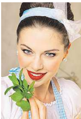
Příroda léčí.

Pokud jde o konstituční předepsání, zeptám se pacienta na to, jaký je člověk, jak reaguje na různé životní situace, jaké má záliby, jaké měl dětství, vztahy v rodině. Samozřejmě se ho také zeptám, jaké má tělesné příznaky. A také mě zajímají takzvané