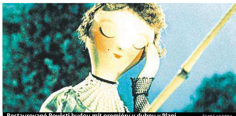
Restaurované Pověsti budou mít premiéru v dubnu v Plzni. ČESKÁ CENTRA

Digitálně restaurované Staré pověsti české , velká retrospektiva Věry Chytilové v Londýně nebo nikdy nespátné záběry z pražského povstání. To jsou projekty, které v letošním roce představí veřejnosti Národní filmový archiv.