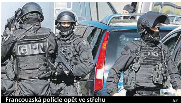
Francouzská policie opět ve střehu

Násilí vypuklo kolem deváté hodiny ranní na sídlišti Castellane, kde zaútočila desítka mladíků v černých oděvech s neprůstřelnými vestami a s kuklami na hlavě. Podle prvních poznatků vyšetřování se snažili obsadit místo, kde konkurenční gang distribuoval drogy. Na přivolané policisty začal pálit z jednoho místního vysokého paneláku muž vybavený puškou s dalekohledem. Bezpečnostní síly včetně zásahových jednotek uzavřely oblast přestřelky,