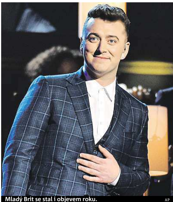
Mladý Brit se stal i objevem roku.

Smith se nakonec stal objevem roku a další tři malé gramofonky získal za nejlepší popové vokální album (debutová deska In The Lonely Hour ), za nahrávku a píseň roku. „Chci poděkovat muži, o něhož tato nahrávka je a do něhož jsem se loni zamiloval. Moc ti děkuji, žeš mi zlomil