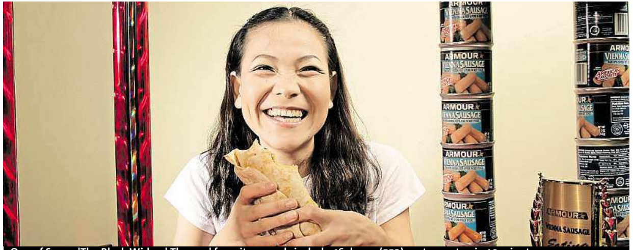
One of Sonya 'The Black Widow' Thomas' favorite records include 46 dozen (552) oysters eaten in 10 minutes.