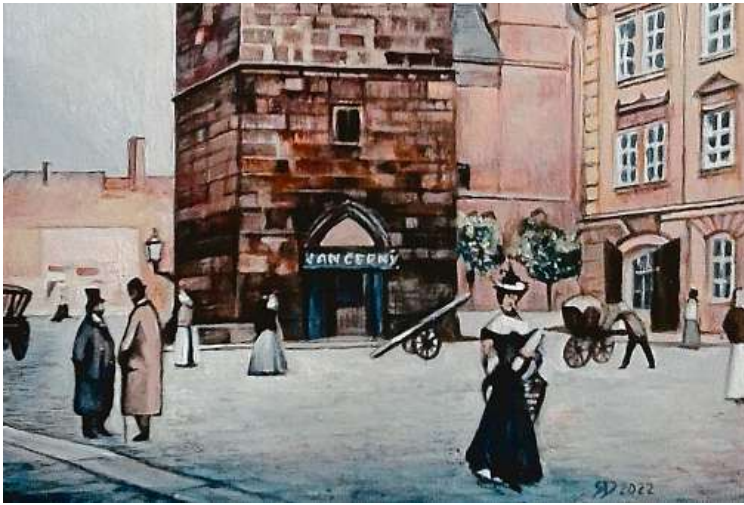
Petrská zvonice s vývěsním štítem Jan Černý