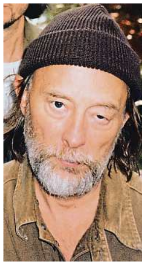
Člen slavné kapely představí svůj projekt The Smile.

Zpěvák Thom Yorke a kytarista Jonny Greenwood ze slavné kapely Radiohead vystoupí 12. června v Praze. Představí se spolu s bývalým bubínkem jazzových Sons of Kemet Tomem Skinnerem ve formaci The Smile. V pražském Foru Karlín odehrají naživo své druhé album nazvané Wall of Eyes, následovní-