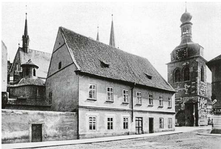
Pozdně gotická věž s barokní bání stojí v blízkosti kostela sv. Petra a Pavla.