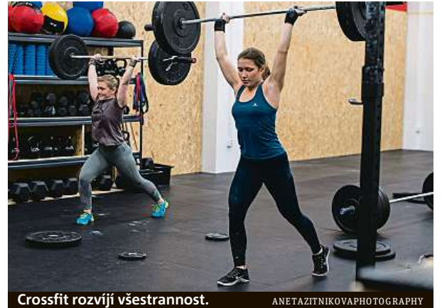
Crossfit rozvíjí všestrannost.

Závěr lekce je posilování. Deset dřepů, desetkrát mrtvý