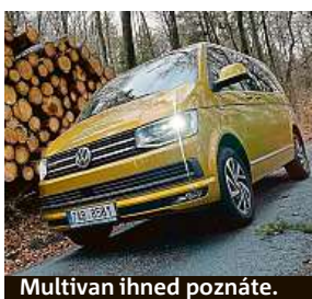
Multivan ihned poznáte.

Předností multivanu je, že parádně jezdí, chová se jako vyšší osobní auto a jeho vlastnosti na silnici jsou fenomenální. Vyzkoušeli jsme verzi s dieslovým čtyřválcem o obsahu dva litry, se 199 koňmi