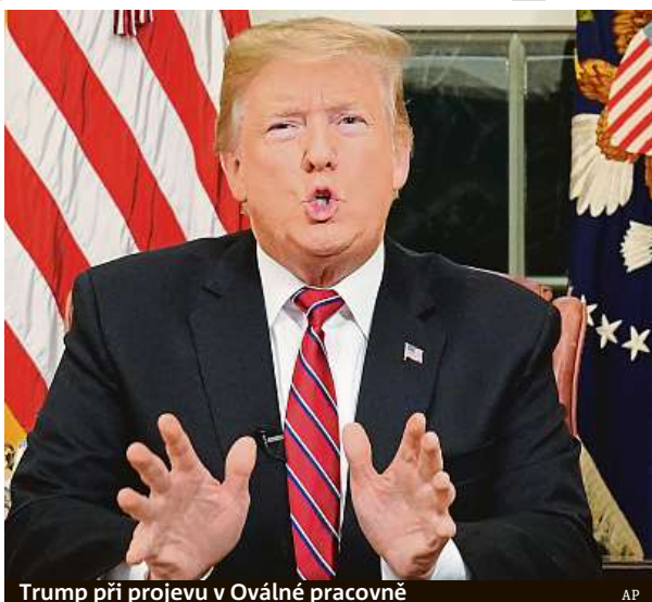
Trump při projevu v Oválné pracovně

Trump ve zhruba devítiminutovém projevu vykreslil v černých barvách absolutně kritickou situaci na hranicích, která podle něj vyústila v bezpečnostní a humanitární krizi. Prezident vyzval opoziční demokraty, aby se s ním v Bílém domě setkali k jednání, protože nečinnost polit-