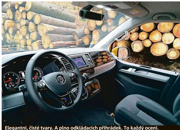
Elegantní, čisté tvary. A plno odkládacích přihrádek. To každý ocení.