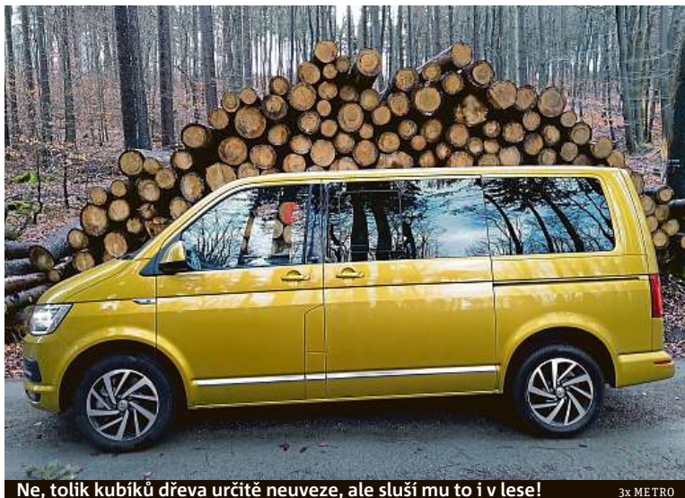
Ne, tolik kubíků dřeva určitě neuveze, ale sluší mu to i v lese!